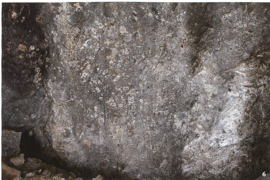
Abb. 6 Die grösste Konzentration von Ritzzeichnungen besteht im mittleren Bereich.

La plus grande concentration de gravures se trouve dans la partie centrale de la paroi.