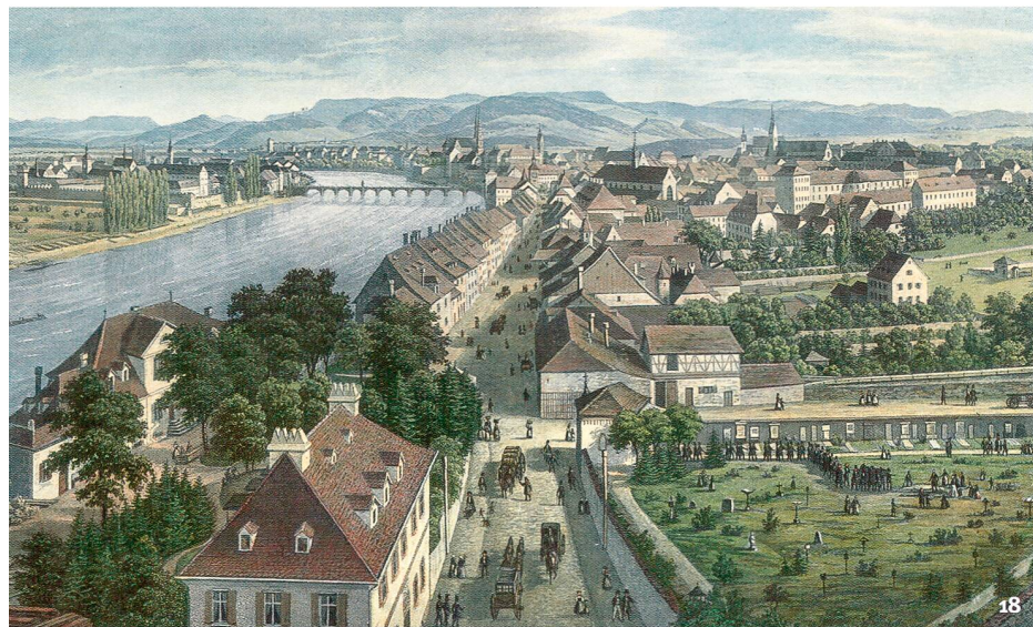
Abb. 18 Bestattungsprozession im städtischen inneren St. Johanns-Gottesacker Basel. Ähnlich darf man sich den Spitalfriedhof vorstellen, nur dass sich die Gräber ordentlich Reihe um Reihe gliederten.

Corteo funebre nel camposanto cittadino di St. Johann di Basilea. Così possiamo immaginarci il cimitero dell'ospedale, anche se lì le tombe erano allineate ordinatamente.