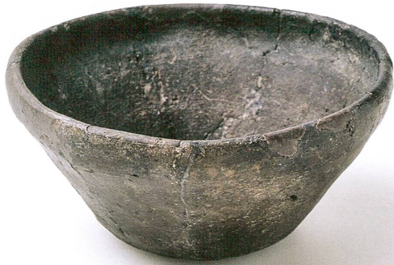
Fig. 10 Les proches de l'individu inhumé dans la tombe 50 avaient déposé auprès du défunt un récipient, un anneau en bronze et un autre en fer, ainsi qu'une pendeloque en forme de rouelle (diam. 2.3 cm).

Nella fossa del defunto della tomba 50 erano stati deposti un anello di bronzo e uno di ferro, un pendaglio a forma di ruota (d. 2.3 cm) e un recipiente.