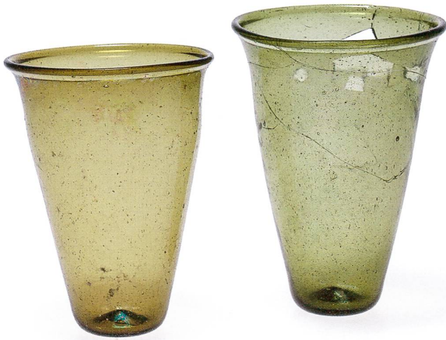
Fig. 20 Bâle-Theodorskirchplatz 7, 2010/11. Les verres à boire des sépultures d'enfants 1 (à gauche) et 6.

Basilea-Theodorskirchplatz 7, 2010/11, bicchieri rinvenuti nelle sepolture di bambino 1 (a sinistra) e 6.