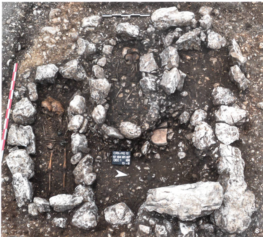
Fig. 8 La structure 8, cave d'époque romaine. Cette construction est réoccupée par plusieurs inhumations d'enfants durant le 7 e siècle.

Der römische Keller (Struktur 8). Dieser Bau wurde als Bestattungsort von mehreren Kindern wiederbenutzt.