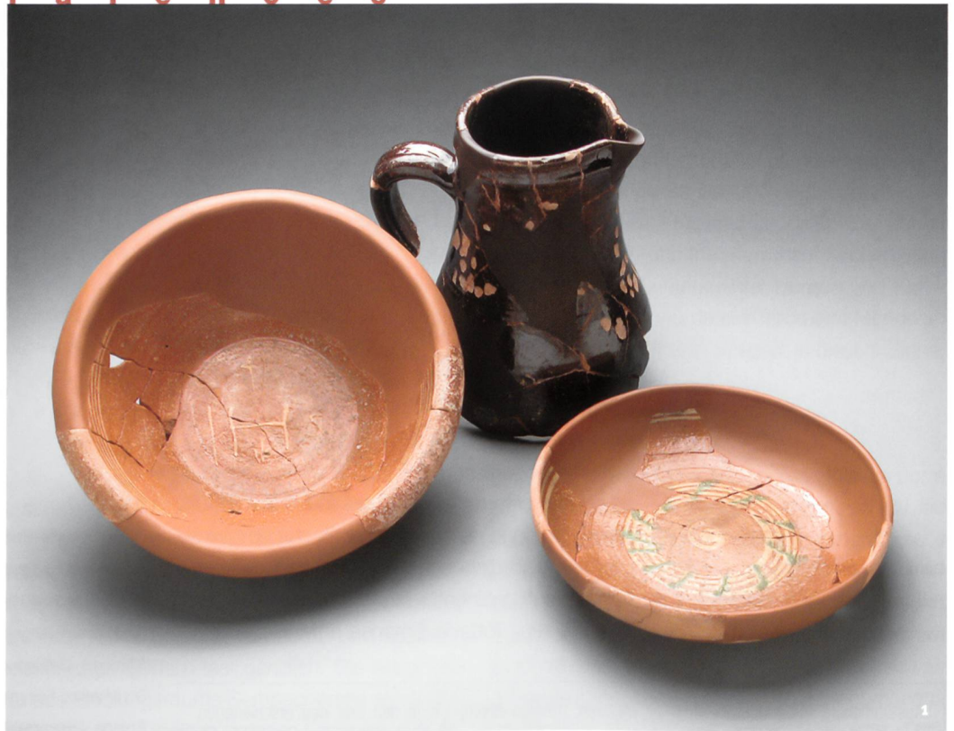
Fig. 1 Productions typiques de Bonfol, 18 e et 19 e siècles.

Typische Produktionen aus Bonfol, 18. und 19. Jh.