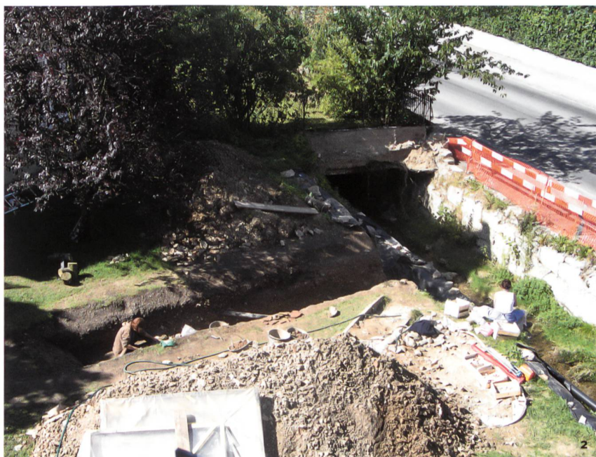
Fig. 2 Vue de la tranchée creusée en 2004 sur le site de la faïencerie de Cornol. Perpendiculaire au gisement, elle a ouvert une fenêtre sur l'amoncellement des différentes couches.

Blick auf den 2004 auf der Fundstelle der Fayencemanufaktur Cornol eingetieften Graben, der die verschiedenen Schichten der Schutthalde im Profil zeigt.