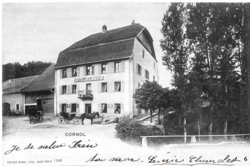
Fig. 6 L'ancienne faïencerie, devenue entre-temps l'hôtel du Lion d'Or, vue de la route principale vers l'ouest, aux environs de 1900. Les fours se trouvaient à l'emplacement du bâtiment attenant sur la gauche (carte postale, collection Y. Rondez).

Die frühere Fayencemanufaktur wurde zwischenzeitlich zum Hotel Lion d'Or. Ansicht von der Hauptstrasse gegen Westen um 1900. Die Brennöfen standen an der Stelle des angrenzenden Gebäudes links im Bild. (Postkarte aus der Sammlung Y. Rondez).