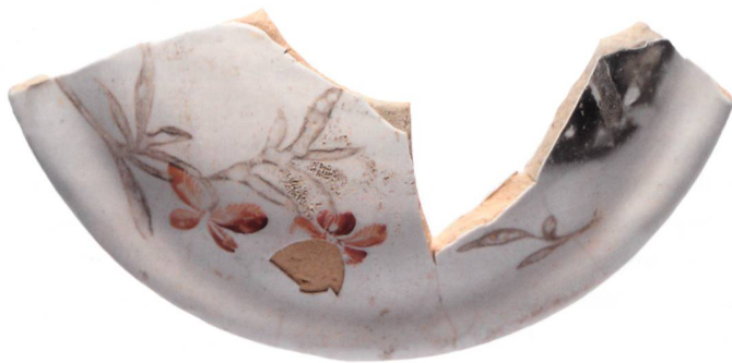
Couvercle de théière ou de cafetière en faïence blanche orné d'un décor rouge au réverbère, provenant de la fouille de Cornol-Lion d'Or. Diamètre 7.5 cm.

légèrement inférieure, est également attesté. Il autorise une palette plus large, y compris certains rouges et roses impossibles à réaliser autrement. Parmi les déchets de fabrication mis au jour à Cornol, de nombreuses pièces en terre cuite se rattachent aux phases de production. Cette céramique technique est semblable à celle décrite dans l'Encyclopédie de Diderot et D'Alembert, contemporaine de la faïencerie. Les objets à cuire étaient préservés des poussières en suspension dans l'atmosphère des grands fours chauffés au bois en prenant place dans des sortes de boîtes circulaires empilables, les cazettes, qui ont été retrouvées en nombre (n os 132-139). Dans les cazettes, les objets étaient écartés l'un de l'autre afin qu'ils ne se touchent pas au moyen de pernettes, sortes de clous de section triangulaire, au nombre de trois par étage. Les pièces qui craignaient moins l'atmosphère du four étaient posées sur des sortes d'échafaudages réalisés à partir de plaques et de pilettes (n o 148).