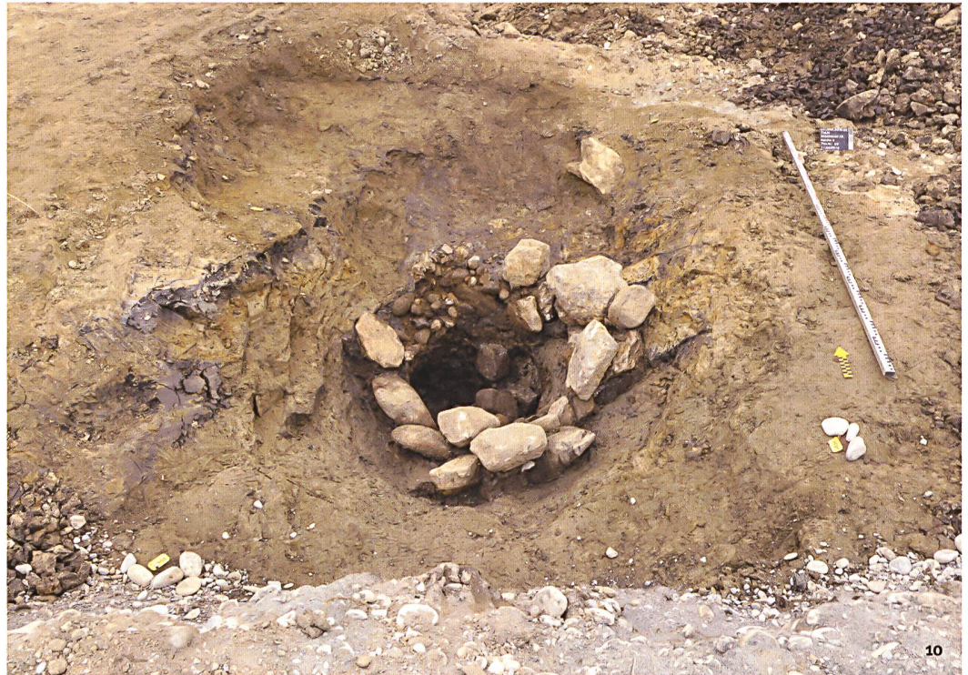
Abb. 10 Thun-Im Schoren. Der Sodbrunnen lässt sich durch Keramikfunde aus der Hinterfüllung und Radiokarbon datieren in die Spätbronzezeit datieren. Es handelt sich um den bisher ältesten bronzezeitlichen Brunnen in Kanton Bern.

Thoune-Im Schoren. La céramique découverte dans son comblement et des analyses radiocarbone datent ce puits de l'âge du Bronze final: Il s'agit donc du plus ancien de cette période découvert dans le canton de Berne.