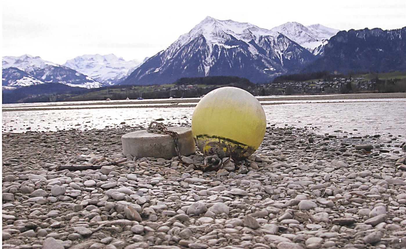
Abb. 1 Das untere Thunerseebecken während der ausserordentlichen Seeabsenkung, Blick auf den Niesen.

Le bassin inférieur du lac de Thoune lors d'une baisse exceptionnelle du niveau des eaux. Vue en direction du Niesen.