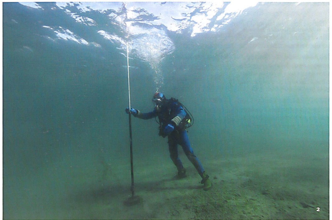
Abb. 2 Thun-Schadau. Vermessung eines Pfahls am Seegrund mit dem GPS. Thoune-Schadau. Mesure d'un pieu au fond du lac à l'aide du GPS. Thun-Schadau. Misurazione di un palo sul fondo del lago con il GPS.

Das systematische Abtauchen des ausgedehnten Areals ermöglichte die Kartierung am Seegrund sichtbarer Befunde, insbesondere Pfähle, sowie die Eingrenzung der Fundstellenausdehnung. Signifikante Oberflächenfunde und erste Dendroproben erlauben eine vorläufige chronologische Zuweisung der Siedlungsstrukturen. Mithilfe von Kernbohrungen konnte nachgewiesen werden, dass stellenweise Kulturschichtreste erhalten sind. Schliesslich sollten Erosionsmarker die Basis für ein zukünftiges Monitoring legen. Bis auf die