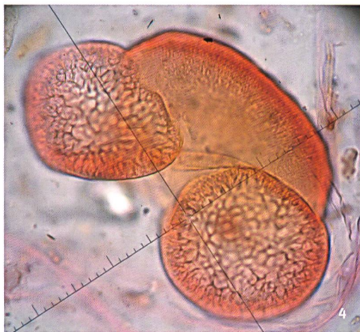
Fig. 4 Granulo pollinico di abete bianco. Pollenkorn der Weisstanne. Grain de pollen de sapin blanc.