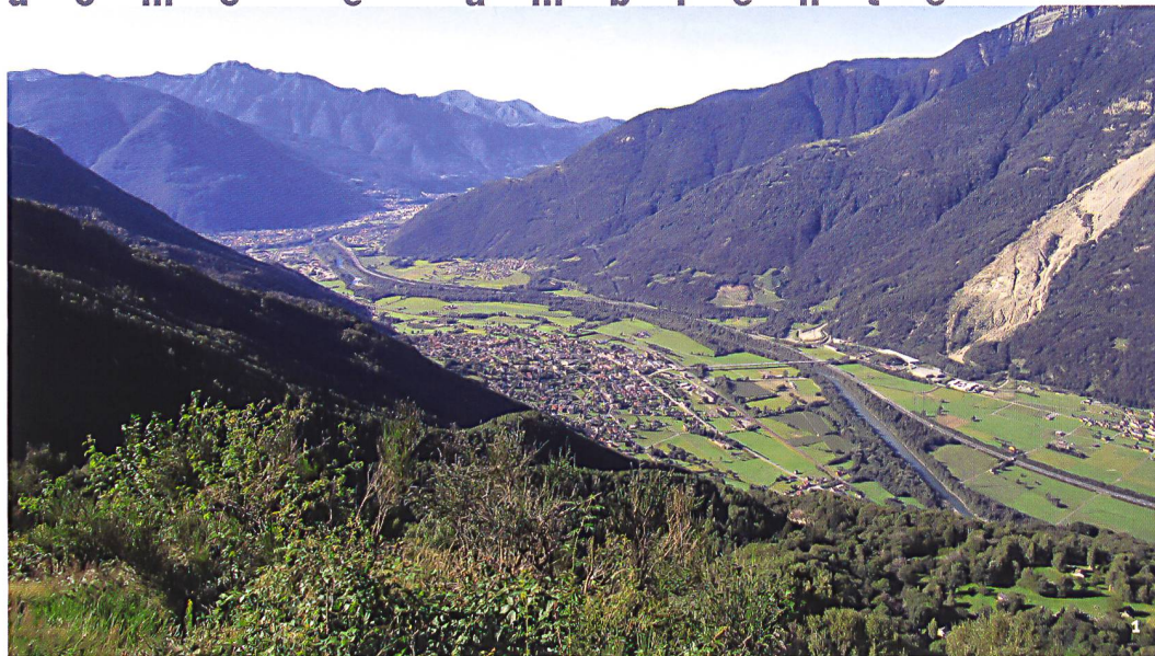
Fig. 1 Veduta di Claro dalla località di Béns. (sguardo verso sud).

Ansicht von Claro von Béns aus (Blick nach Süden).