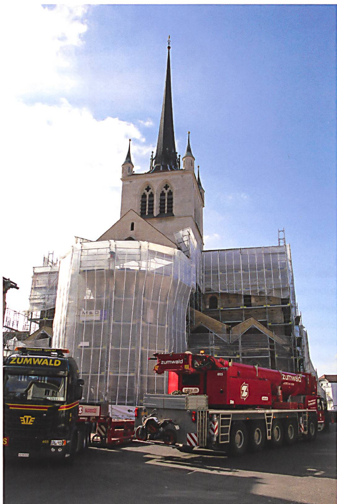
Fig. 1 Payerne VD, l'Abbatiale en cours de restauration en hiver 2016.