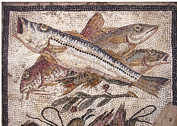
Fig 2 Particolare del mosaico delle anatre dei pesci rinvenuto a Pompei e conservato al Museo archeologico Nazionale di Napoli.