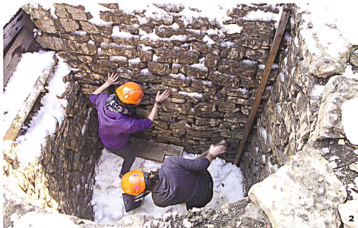
Abb. 2 Festtreten des eingefüllten Schnees während des ersten Versuchs im März 2016.

Besser funktionierte beim zweiten Versuch die Erfassung der thermohygraphische Messwerte mit Hilfe von Datenloggern. Im unteren Teil des Schachts bewegte sich die Temperatur während des Schmelzens des Schnees zwischen Januar und