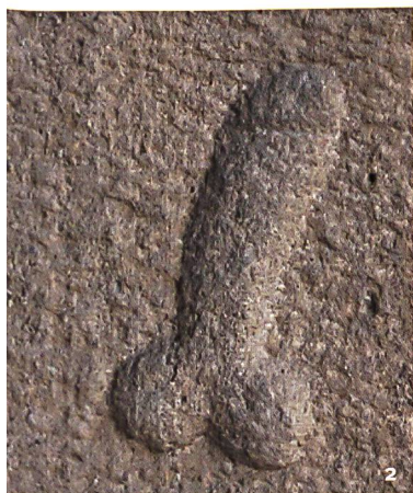
Fig. 2 Rilievo fallico sullo stipite di una porta di Augusta Raurica.