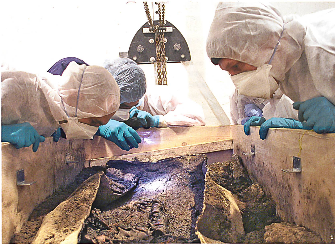
Abb. 1 Am soeben geöffneten Bleisarg: Spezialkleidung schützt die Mitarbeiter vor bleihaltigem Staub und das Skelett vor fremder DNA. Über den Köpfen sind die Saugnapfe der eigens für den Sargdeckel konstruierten Hebevorrichtung sichtbar.