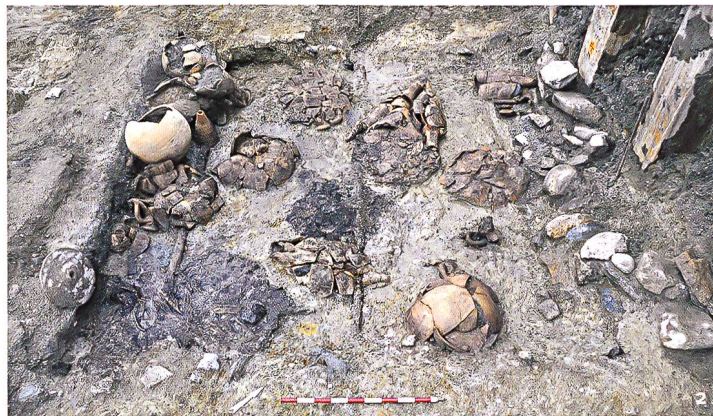
Fig. 2 Latrines d'époque romaine.

Dans la partie sud du chantier, on retrouve des aménagements extérieurs (murs de clôture, canalisations, cours pavées, etc.) appartenant aux différentes propriétés privées qui se sont succédées sur le site depuis la Réforme, jusqu'à l'actuel «château» de Vidy (1771-1776). _Romain Guichon