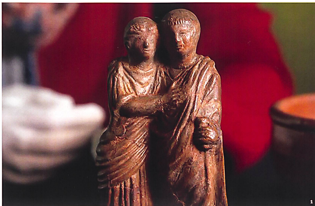
Fig. 1 Stauetta di una coppia d'innamorati rinvenuta in una tomba della necropoli di Muralto-Liverpool.