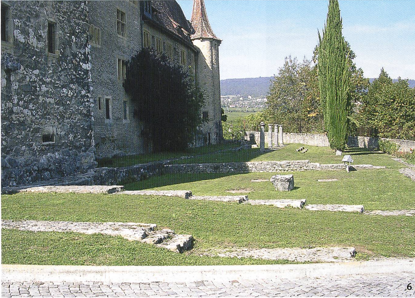
Abb. 6 Blick auf die südöstliche Fassade des heutigen Schlosses, dessen unterer Teil noch aus den Mauern der Hauptfassade der römischen villa besteht. Im Vordergrund: die Überreste des südlichen Eckvorbaus; im Hintergrund: die 1840 entdeckten Säulen toskanischer Ordnung.

Veduta della facciata sud-est del castello. La parte inferiore delle mura è costituita dalla facciata principale della villa romana. In primo piano, le vestigia del padiglione d'angolo meridionale; in secondo piano le colonne di ordine toscano scoperte nel 1840.