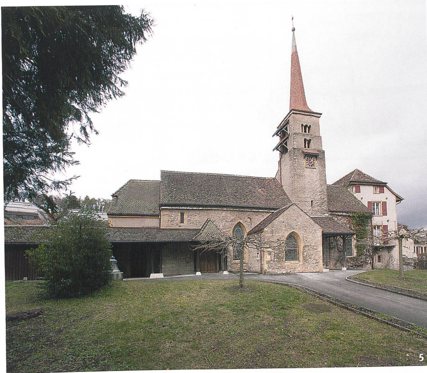
Abb. 5 Die Kirche mit ihrem romanischen Glockenturm.