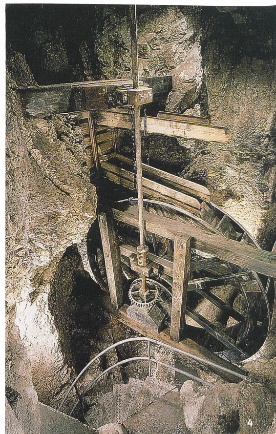
Abb. 4 Becherrad, das seit 1984 im Innern der Höhle im Schacht Nr. 2 sitzt.

Sein Fussboden bestand auf der Westseite aus einer groben Pflasterung und auf der Ostseite aus gestampfter Erde, die mit einer dicken Schicht Sägemehl bedeckt war. In der Mitte wurden zwei rechteckige, gemauerte Gruben mit Seitenlängen von 2 x 0.7 m und einer Tiefe von 0.7 m freigelegt, die untereinander durch massives Mauerwerk verbunden waren (Abb. 2.12). Die bearbeiteten Oberflächen der