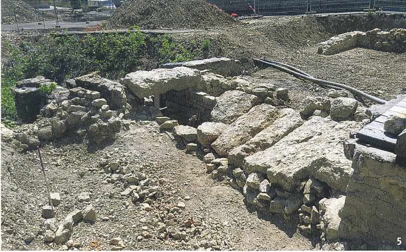
Abb. 5 Übersicht der am Fusse der Fassade freigelegten Mauern. Im Vordergrund: die äusseren Ruinen des Gangs, der den ursprünglichen Abfluss ersetzt hat. Im Hintergrund: die Mauern des ursprünglichen Damms.

Veduta dell'opera muraria portata alla luce ai piedi della facciata. In primo piano, le vestigia esterne della galleria che ha rimpiazzato il canale. Sullo sfondo le mura della diga originaria.