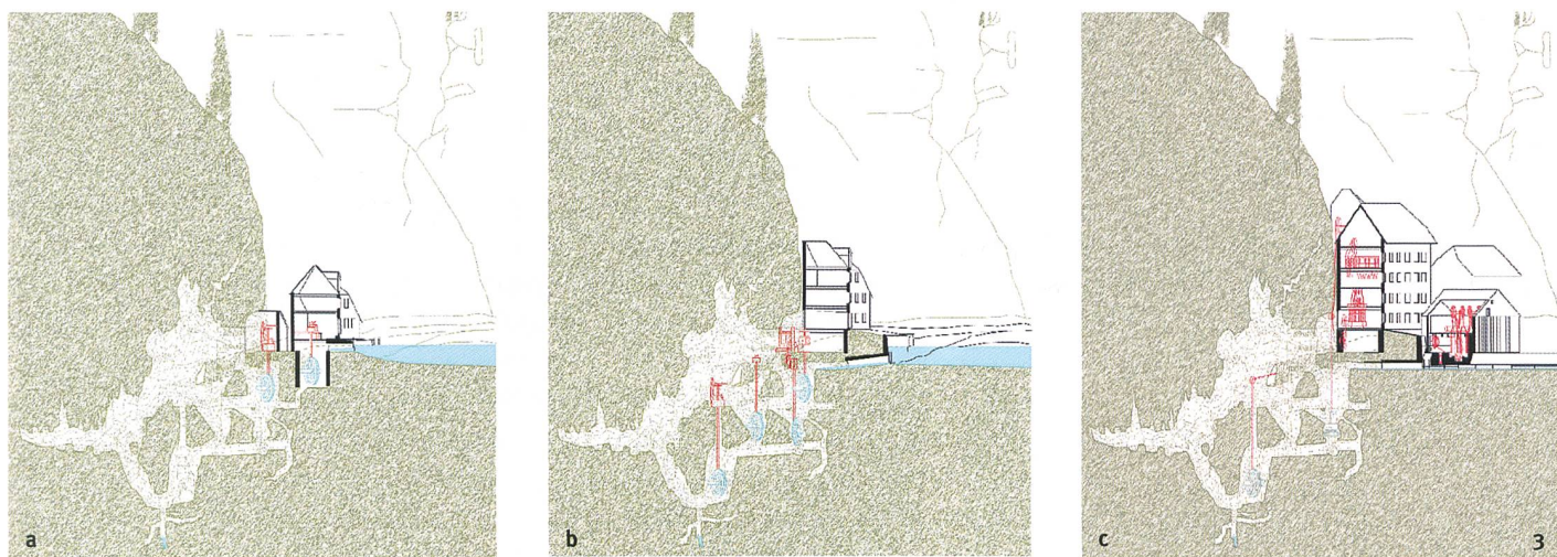
Abb. 2 Fundstellenplan. 1) Höhle; 2) Abfluss mit Transmissionsgang; 3) Mühle von la Roche (1651); 4) Erweiterung der Mühle (1856); 5) Mühle (1739); 6) «Zisterne»; 7) Zisternen-Mühle (1651); 8) Transmissionsgang (1856); 9) Staumauer und Fassung (1651); 10) Hydraulikpumpe (19. Jh.); 11) Landwirtschaftsgebäude (18. Jh.); 12) Gattersägen (1856); 13) Sägewerk (1856); 14) Kreissäge (1856); 15) Zuleitung (1805); 16) Speicherteich (17.-18. Jh.).

Pianta delle vestigia. 1) Grotta; 2) pozzo di scola e in seguito galleria di trasmissione; 3) mulino della Rocca (1651); 4) ampliamento del mulino (1856); 5) mulino (1739); 6) «cisterna»; 7) mulino della Citerne (1651); 8) galleria di trasmissione (1856); 9) diga e captazione (1651); 10) pozzo a pompa idraulica; 11) edificio rurale (XVIII sec.); 12) fosse delle seghe a telaio (1856); 13) segheria (1856); 14) fossa della sega per la sega circolare (1856); 15) canale d'alimentazione (1805); 16) bacino di accumulazione (XVII-XVIII sec.).