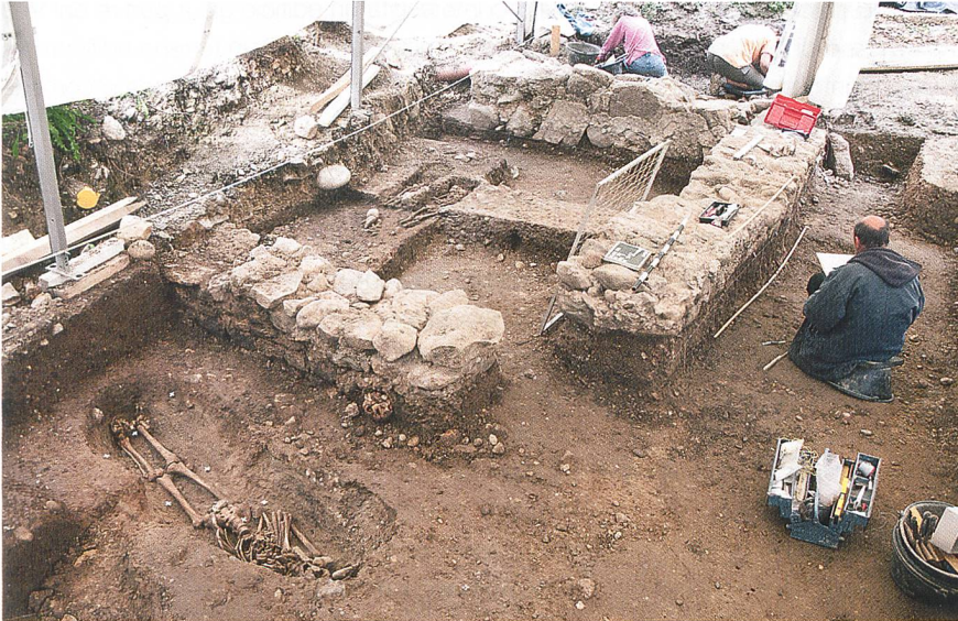
Corcelles, mittelalterliches Priorat. Teilansicht der Fundamente des Westgebäudes mit den älteren Gräbern.

Corcelles, priorato medievale. Veduta parziale delle fondamenta dell'edificio occidentale con le tombe più antiche.