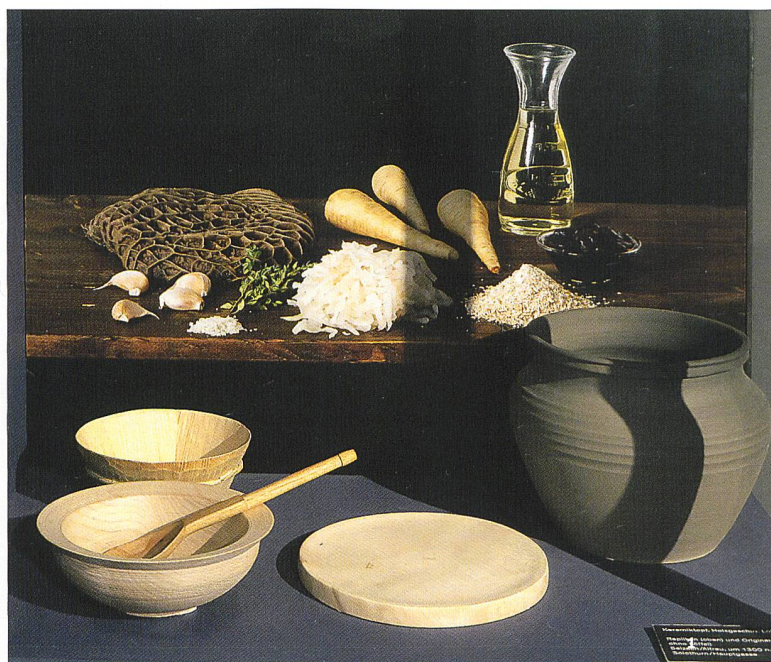
Abb. 1 Das einfache Mahl eines römischen Landarbeiters und die Sonntagssuppe der mittelalterlichen Fischhändlerin sind zwei Mahlzeiten, die es in der Sonderausstellung «Wer is(s)t denn da?» zu entdecken gibt.

Das Kulturama feiert 2018 sein 40. Jubiläum. Sein Gründer, Paul Muggler, schuf das Museum des Menschen eigens für die Vermittlung von Wissen und Wissenschaft an das breite Publikum und leistete damit in den 1970-er Jahren Pionierarbeit in der Schweizer Museumspädagogik. Jährlich werden im Kulturama über 550 museumspädagogische Angebote für alle Altersgruppen durchgeführt – mit 25 000 Besuchenden zählt es heute zu den Top-Ten-Museen der Stadt Zürich.