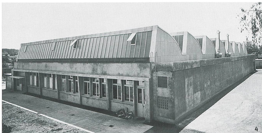
Fig. 4 Construit entre 1958 et le milieu des années 1960 sur des plans de l'architecte Horace Decoppet, le bâtiment qui abrite le dépôt est remarquable par son jeu d'éléments en saillie et de formes carrées.

Das zwischen 1958 und den mittleren 1960-er Jahren nach einem Entwurf des Architekten Horace Decoppet erbaute Gebäude, in dem sich das Depot befindet, zeichnet sich durch sein Zusammenspiel von vorspringenden und rechteckigen Formen aus.