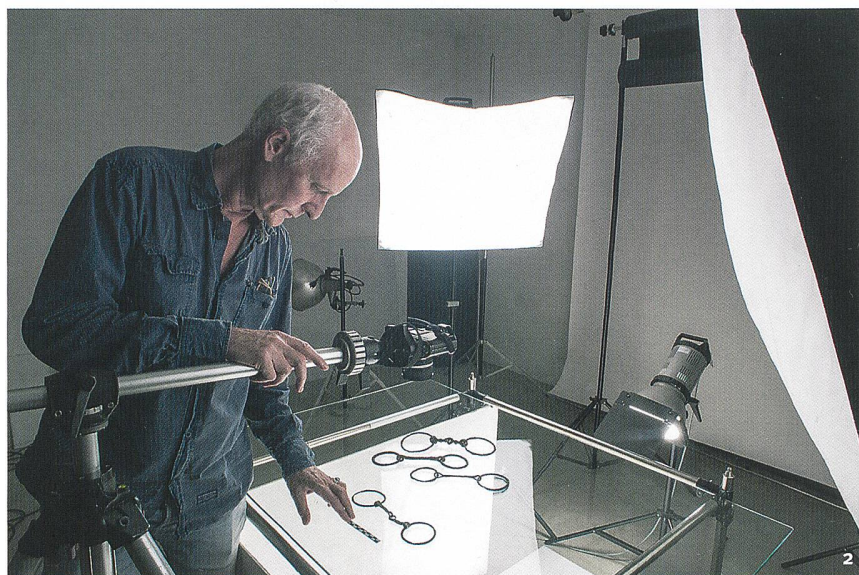
Fig. 2 L'intégralité de la collection La Tène du Laténium a fait l'objet d'une révision complète de sa documentation: inventaire, restauration et photographies.

L'insieme della collezione La Tène del Laténium è stata oggetto di una revisione completa della sua documentazione: inventario, restauro e fotografie.