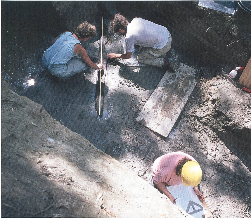
Fig. 3 Fouilles de La Tène en août 2003. Dégagement d'une planchette datée par dendrochronologie de 3824 av. J.-C. (Néolithique).

Scavi di La Tène nell'agosto del 2003. Viene portata alla luce un'asse datata al 3824 a.C. (Neolitico).