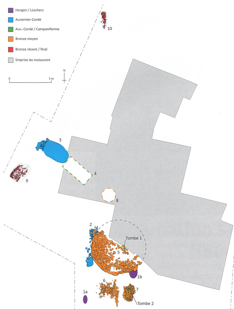
Fig. 5 Plan général des structures archéologiques par phases chronologiques. 1a-b foyers du Néolithique final; 2 alignement mégalithique; 3 menhir couché; 4 dolmen; 5 tumulus (tombe 1 au centre); 6 tombe à incinération; 7 tombe à inhumation (tombe 2); 8 tombe à inhumation de 1876 (emplacement supposé); 9-10 fosses-foyers.

Pianta generale delle strutture archeologiche ordinate per fasi cronologiche. 1a-b Focolari del Neolitico finale, 2 allineamento megalitico; 3 menhir steso; 4 dolmen; 5 tumulo (tomba 1 al centro); 6 tomba a incinerazione; 7 tomba a inumazione (tomba 2); 8 tomba a inumazione del 1876 (localizzazione presunta); 9-10 fosse-focolari.