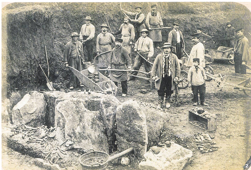
Fig. 2 Dolmen mis au jour en 1876 en cours de fouille.

Dolmen portato alla luce nel 1876 in corso di scavo.