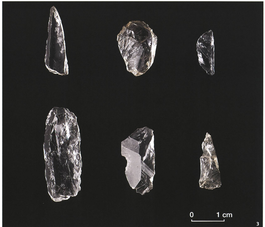
Fig. 3 Artefatti mesolitici in cristallo di rocca dal sito di Airolo-Alpe di Rodont.

Im Neolithikum und in der Bronzezeit kam es zu einer Intensivierung des Passverkehrs in den Alpen. Aus dieser Zeit kennt man zahlreiche Höhengiedlungen, die mit der Kontrolle von transalpinen Handelswegen zusammenhängen. Bergkristall spielte nach wie vor eine wichtige Rolle als lithisches Rohmaterial, wie Funde aus der Gegend um Airolo zeigen. Ein gutes Beispiel für das handwerkliche Geschick der Menschen im Neolithikum ist die Pfeilspitze von Bellinzona-Castel Grande (Abb. 1). Artefakte aus Bergkristall sind auch aus Seeufersiedlungen im Schweizer Mittelland bekannt.