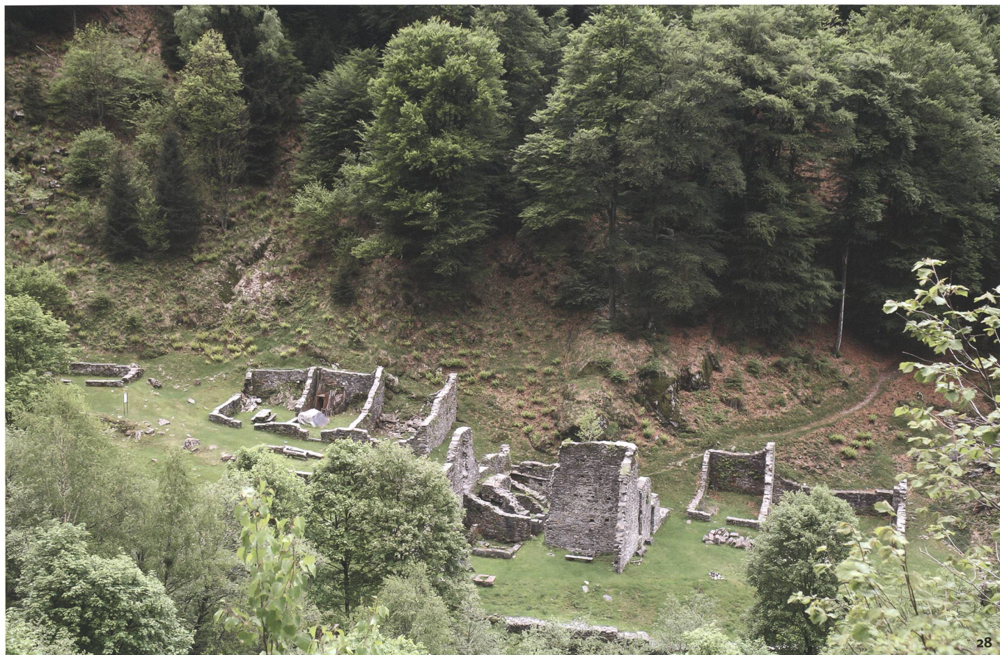
Fig. 28 Vestigia dell'impianto siderurgico di Carena.