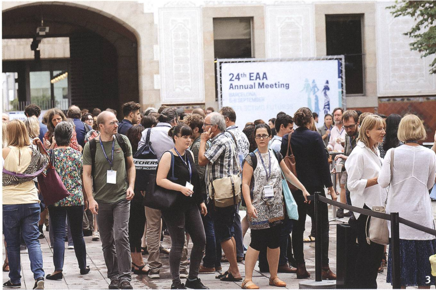
Fig. 3 Barcelona 2018: For the first time more than 3000 participants took part in an EAA Annual Meeting.

Barcelone 2018: pour la première fois, plus de 3000 participants ont pris part à une rencontre annuelle de l'EAA.