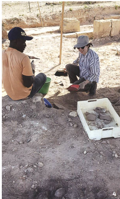
Fig. 4 Le travail partagé permet l'échange d'expériences.