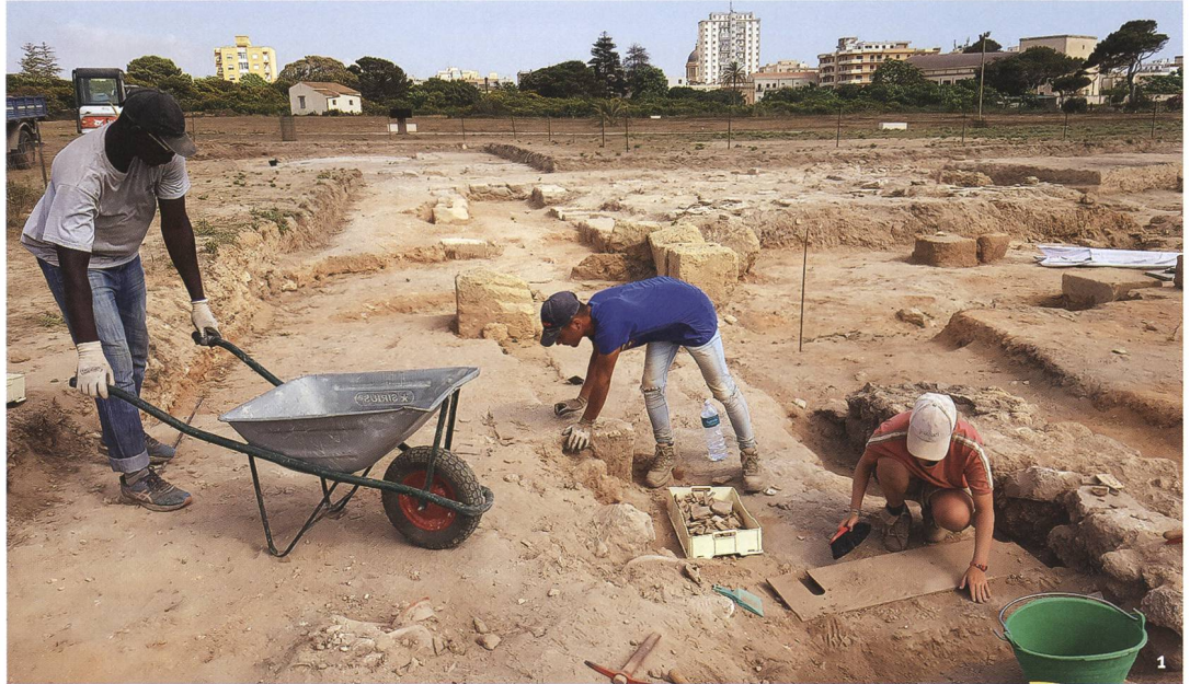
Fig. 1 Ancienne cité de Lilybée (actuelle Marsala). Premiers dégagements dans la partie occidentale du site. L'intervention de 2019 s'est déroulée dans le cadre du projet «Archéologie Solidaire».