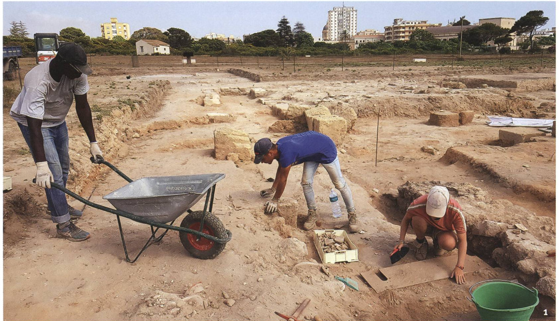
Fig. 1 Ancienne cité de Lilybée (actuelle Marsala). Premiers dégagements dans la partie occidentale du site. L'intervention de 2019 s'est déroulée dans le cadre du projet «Archéologie Solidaire».