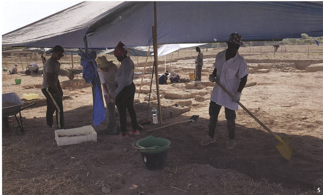
Fig. 5 Les travaux de fouilles nécessitent une étroite collaboration, sans savoir ce que la prochaine couche stratigraphique réserve