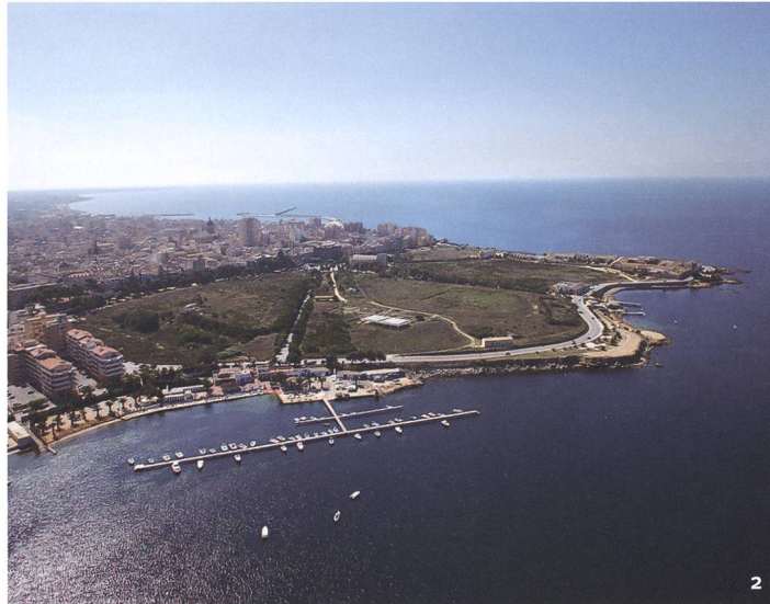
Fig. 2 Vue de la ville actuelle de Marsala, l'ancienne Lilybée. Au premier plan, le parc archéologique, aménagé en 2006.

la fois la formation des participants et la qualité de leur travail par un double encadrement, scientifique et humanitaire. L'équipe genevoise n'a pas ménagé ses efforts, aidée