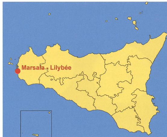
Carte de la Sicile avec l'emplacement de Marsala-Lilybée.

Les travaux sur le terrain ont été conduits du 3 juin au 26 juillet 2019. La campagne impliqua un total de 28 personnes, réunissant des spécialistes scientifiques, deux architectes, un dessinateur, une restauratrice et quatre ouvriers spécialisés. Dix réfugiés, originaires de Gambie, du Nigeria, du Sénégal, du Togo et