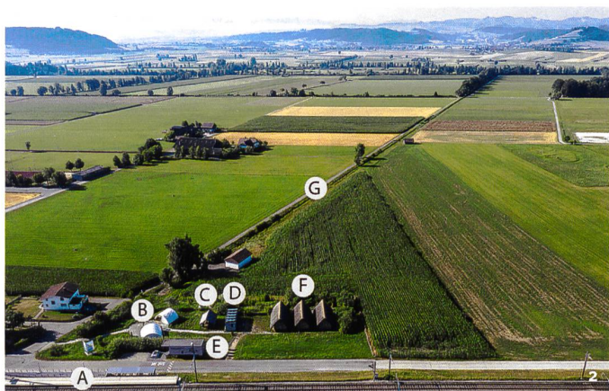
Abb. 3 Im Rahmen von Führungen, Workshops und Events finden Angebote wie Speerschleuder- und Pfeilbogenschiessen, Hausbau in der Jungsteinzeit, Brotbacken, Feuer schlagen und Metall giessen statt.

Dans le cadre de visites guidées, d'ateliers et de manifestations sont proposées des activités comme le lancer d'une sagaie avec un propulseur, le tir à l'arc, la construction de maisons néolithiques, la cuisson du pain, le démarrage d'un feu et le moulage du métal.