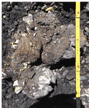
Abb. 2 Eine Probe des Geflechts aus Lindenbast wurde ins 5. Jt. v.Chr. datiert.

Gletscher und Firnfelder sind besonders wertvolle archäologische Archive, da sie zahlreiche Informationen über die prähistorischen