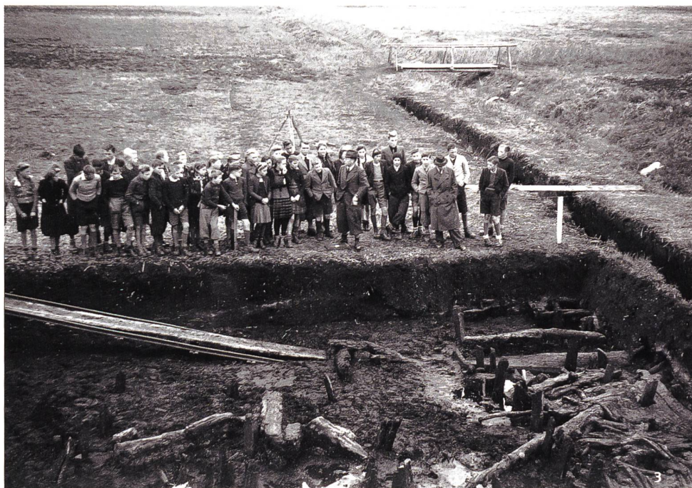
Abb. 3 «KKT» führt im Herbst 1944 eine Schulklasse über die Ausgrabung in Pfy-Breitenloo.

«KKT» conduit une classe d'école sur la fouille de Pfy-Breitenloo en automne 1944.