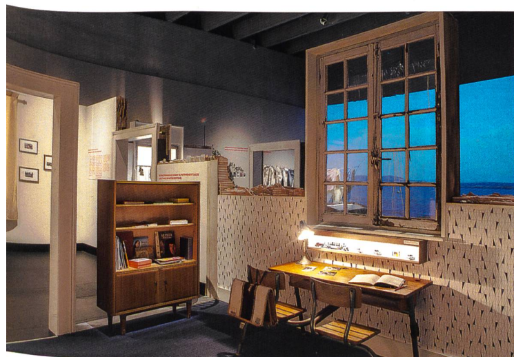
Fig. 2 L'exposition Emotions patrimoniales prenait place dans un appartement en ruine reconstitué par la scénographe Elissa Bier. Les visiteurs découvraient, à la façon des archéologues, les traces laissées par des personnes qui avaient habité cet appartement imaginaire.

Pour une majorité de répondants, les histoires contées à travers les photographies et récits exposés rappellent des histoires personnelles.