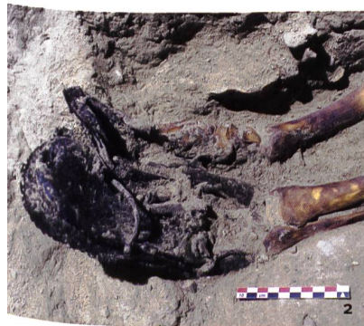
Fig 2 Paire de chaussures «en mufle de vache» d'époque Renaissance en cours de dégagement en 2017 (ensemble n°72 - T87, étude M. Volken).

Aujourd'hui, l'étude et la documentation complète des superstructures ont permis d'identifier les vestiges de ces différentes époques, ainsi que de suivre la progression du chantier des 12 e -13 e siècles, cette dernière étant marquée par des changements de projets importants. De la documentation des étapes de construction à l'identification du mode de couverture médiéval, en passant par l'inventaire des marques laissée par les tailleurs de pierre et l'examen des restes de décors peints qui ont miraculeusement survécu aux restaurations précédentes, il est désormais possible d'appréhender finement le déroulement du chantier médiéval et de restituer l'aspect originel de l'édifice.