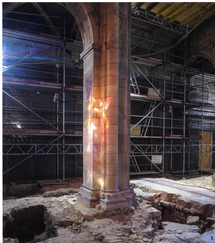
Fig 1 Collégiale de Neuchâtel, fouilles archéologiques en 2017.

Au cœur de l'ancienne forteresse rodolpheine de Novum Castellum (vers 1000; voir as. 34.2011.3), la construction de l'essentiel de l'église actuelle et du cloître qui la jouxte au nord débute dans le dernier quart du 12 e siècle et se poursuit jusqu'au milieu du 13 e siècle. A la fin du Moyen Age, la Collégiale Notre-Dame subit divers réaménagements, dont la reconstruction complète du cloître suite au gigantesque incendie qui ravagea la ville en 1450. Devenu le Grand Temple de Neuchâtel après la Réforme, menée par Guillaume Farel en 1530, l'église ne va connaître que des interventions assez superficielles jusqu'en 1869, date à laquelle est entamée une restauration historicisante, particulièrement radicale et totalement dépourvue de documentation archéologique.