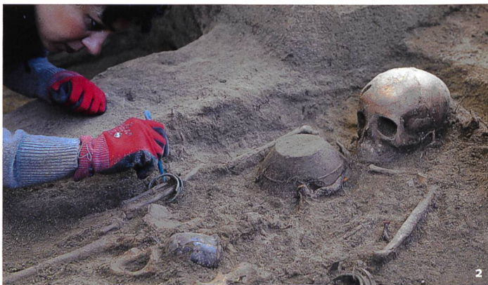
Abb. 2 Rhäzüns GR, Via Castugls: Sorgfältige Freilegung eines gut ausgestatteten, spätantiken Grabes.