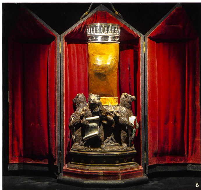
Fig. 6 L'objet comme palimpseste: gobelet cérémoniel fabriqué en 1870 dans le pouce d'une statue monumentale en bois de saint Christophe, datant du 15 e siècle. Confrérie bernoise des forgerons. Hauteur: 50 cm.

Emotions patrimoniales avait pour but de rappeler aux visiteurs la place importante que le patrimoine occupe dans nos vies. Les lieux patrimoniaux constituent des marqueurs dans le paysage et des repères dans nos biographies personnelles et collectives. En rassemblant des images qui révèlent des aspects du patrimoine local, et non exotique, nous en assumions la banalité et voulions en souligner le caractère familier. Et en adoptant un point de vue non expert, notre objectif était aussi de rappeler à nos collègues archéologues que, si la patrimonialisation répond à des critères scientifiques d'exemplarité ou de rareté, ses appropriations publiques rendent compte d'une variabilité insoupçonnée, qui enrichit notre discipline. Géraldine Delley, Ellinor Dunning, Marc-Antoine Kaeser et Camille Linder