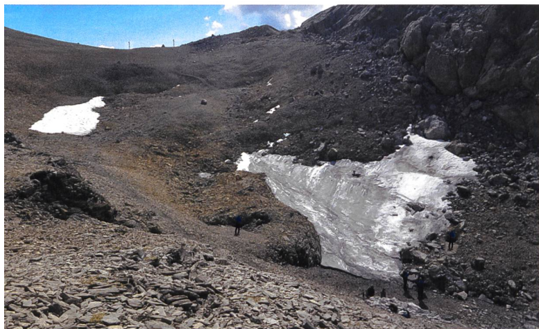
Abb. 1 Das Schnidejoch (BE) im Hintergrund mit dem noch erhaltenen Firnfeld am 10. September 2018 (l.). Am 4. September 2019 (r.) ist es fast verschwunden. 2005 war die Geröllschulter links noch von Eis bedeckt.