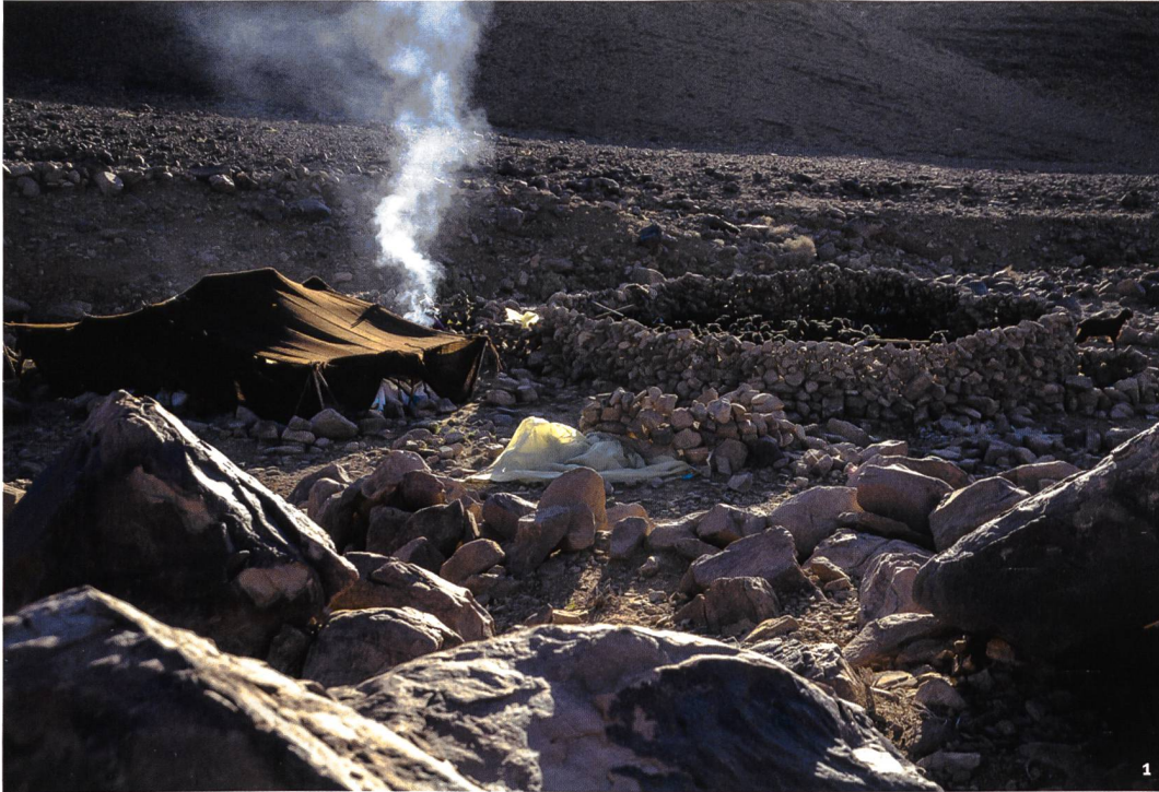
Abb. 1 Das Winterlager mit Zelt und Viehpferch im Jbel Sagrho, Südmorokko, 2018.

Le campement d'hiver: tente et enclos pour le bétail dans le Jbel Sagrho, sud du Maroc, 2018.