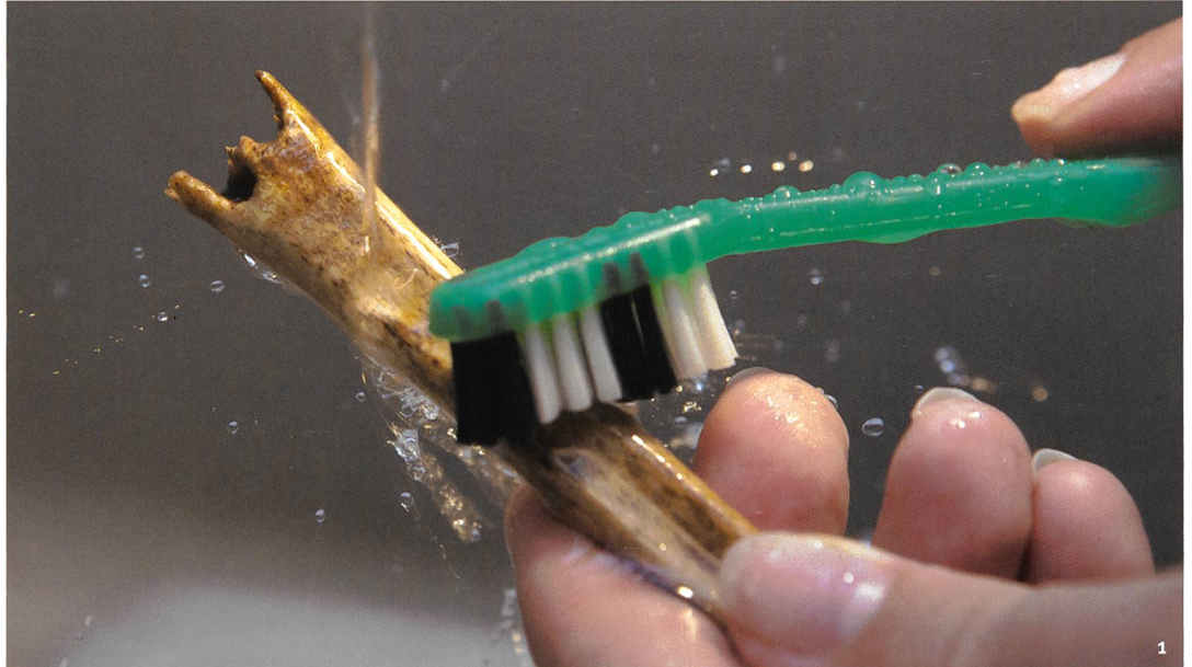
Fig. 1 Chasse au trésor à la brosse à dents. Caccia al tesoro con lo spazzolino.