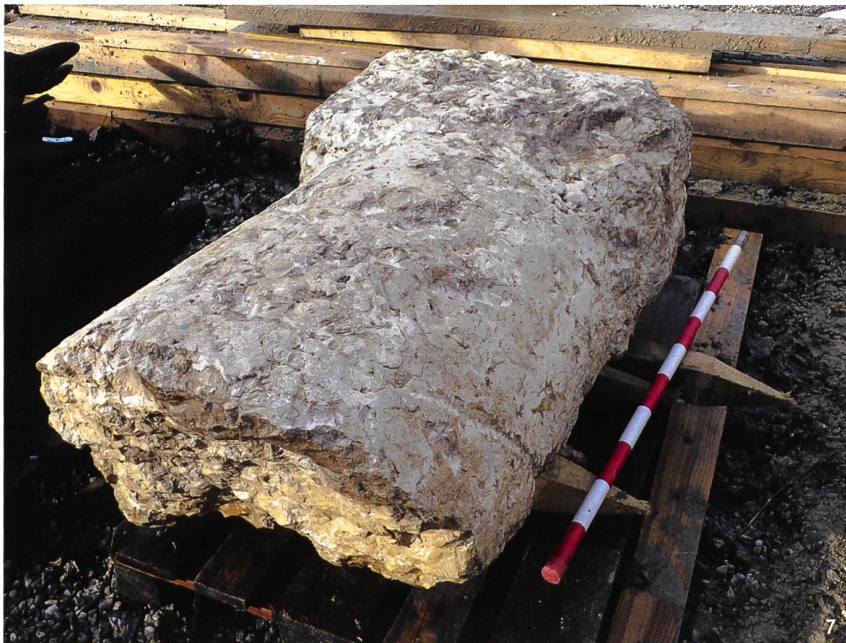
Fig. 7 Le milliaire A lors de son prélèvement. Base: larg. 80 cm, prof. conservée 50 cm; haut. 60 cm. Cylindre: diam. 68 cm, haut. 79 cm. Poids total 842,5 kg; haut. totale conservée 139 cm.

Meilenstein A in Fundlage. Basis: Breite 80 cm, erhaltene Tiefe 50 cm; Höhe 60 cm. Zylinder: Dm. 68 cm, Höhe 79 cm. Gesamtgewicht 842.5 kg; erhaltene Gesamthöhe 139 cm.