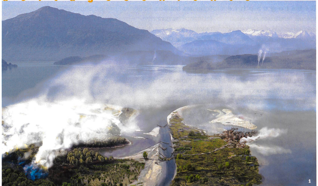
Abb. 1 Visualisierung des Wohnplatzes von Zug-Riedmatt (32. und 31. Jh. v.Chr.) in seiner Umwelt im Lorzedelta, im Hintergrund der Zugersee mit Rigi und Alpen. Die zahlreichen Möglichkeiten und Ressourcen des Deltas werden genutzt: Es sind Fischfanganlagen, eine Flachs- und eine Hirschrudel- und geschneitelte Bäume dargestellt, ausserdem kontrollierte Feuerrodung zur Schaffung neuer ökologischer Nischen.

Visualisation de l'habitat de Zoug-Riedmatt (32 e et 31 e s. av. J.-C.) dans son environnement naturel du delta de la Lorze, avec en toile de fond le lac de Zoug, le Rigi et les Alpes. Les multiples ressources exploitées dans le delta y figurent: des pêcheries, une installation pour rouir le lin, une harde de cerfs et des arbres ébranchés. Des incendies contrôlés permettent de défricher de nouveaux espaces.