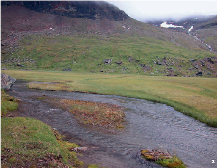
Abb. 2 Lebensbedingungen wie in der späten Eiszeit: heutige Landschaft im schwedischen Teil von Lappland. Il paesaggio moderno nella parte svedese della Lapponia rispecchia le condizioni di vita della fine dell'era glaciale.