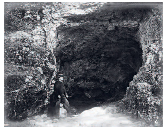
Abb. 4 Die ausgegrabene Höhle Winznau-Käsloch um 1904/1905. La caverna indagata a Winznau-Käsloch verso il 1904-1905.

Mit den Wildtieren zogen auch die Menschen umher. Auf der Suche nach guten Jagdgebieten legten sie teils Hunderte von Kilometern zurück. Alles musste mitgetragen werden: Zelte, Werkzeuge, Waffen, Kleider, Nahrungsmittel. Es war hauptsächlich die Jagd, die die Existenz der Menschen sicherte. Ein gutes Jagdgebiet war ein entscheidender Faktor für die Wahl und die Dauer eines Siedlungsplatzes. Die Menschen wohnten