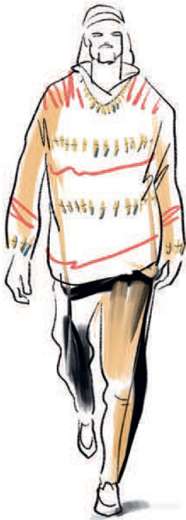
EISZEITJÄGER UM 13'000 V. CHR.

Abb. 8 Eiszeitjäger aus dem Magdalénien. Feine Knochenadeln aus der Risliisberghöhle. Länge 2.3-4.2 cm, Breite 2 mm.