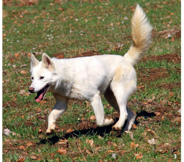
Abb. 3 Vor 32 000 Jahren – der Wolf wird zum Hund und begleitet den Menschen auf seinen Streifzügen. 32000 anni fa – il lupo diventa cane e accompagna gli esseri umani nelle loro scorrerie.