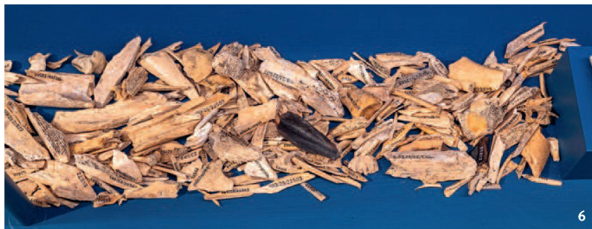
Quattordici delle oltre 700 lamelle a dorso rinvenute nella caverna di Rislisberg.