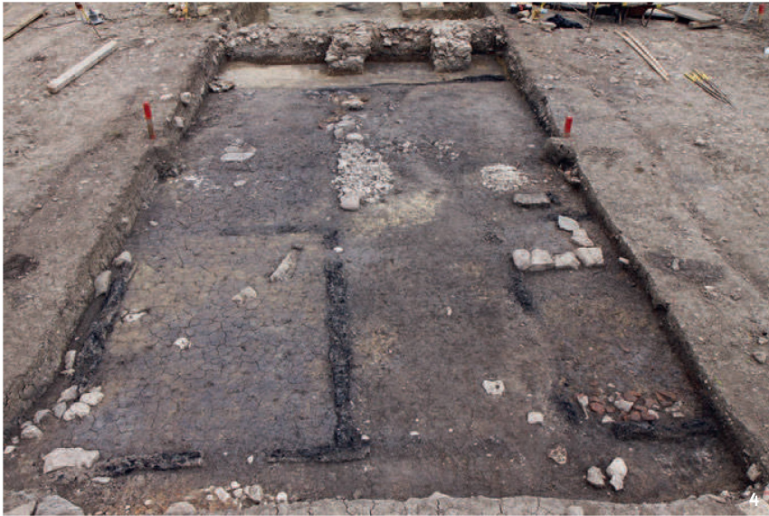
Abb. 4 Im Vordergrund das gassenseitige Hausdrittel mit Kammer (l.) und Stube mit Ofenfundament (r.). Dazwischen führte ein Korridor in die Küche im Mittelteil.

In primo piano il terzo della casa rivolto sul vicolo con ripostiglio (a sinistra) e soggiorno con le fondamenta della stufa (a destra). Nel mezzo, un corridoio conduceva alla cucina situata nella parte centrale.