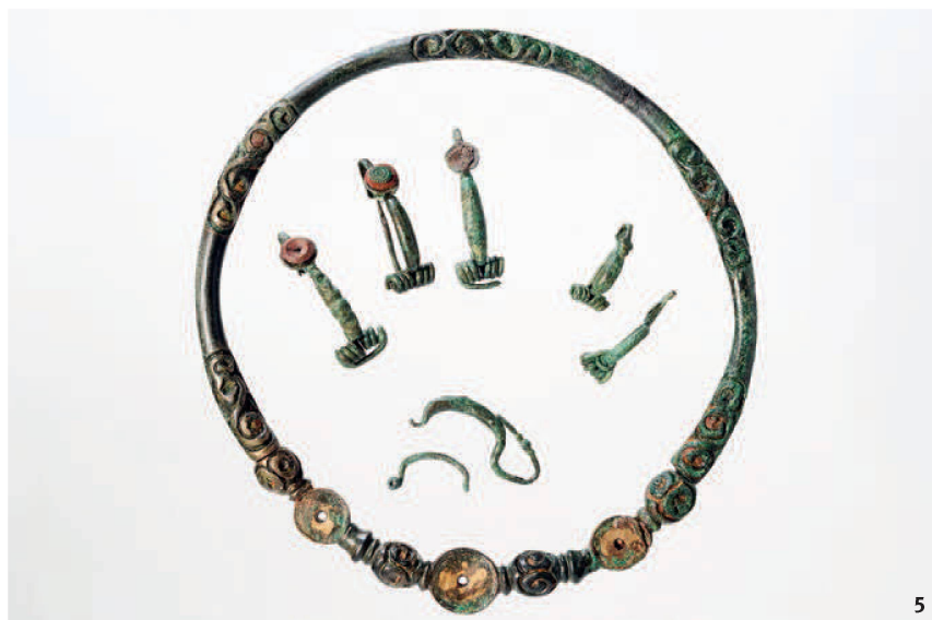
Fig. 5 Dornach. Mobilier de la tombe d'une Celte aisée. Vers 350 av. J.-C.

Dornach. Corredo funerario di una ricca donna celtica. Verso il 350 a.C.