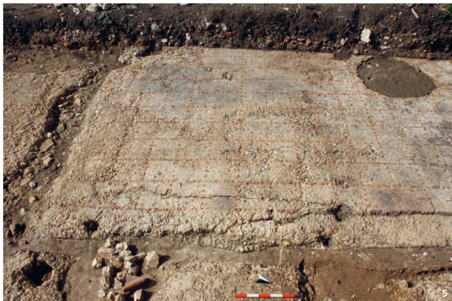
Fig. 5 Sol de mortier orné de quadrillages ( opus signinum ) découvert dans le bâtiment principal de la villa d'Oensingen-Bienken.

Pavimento in cocchiopesto (opus signinum) decorato da un reticolato nell'edificio principale della villa di Oensingen-Bienken.