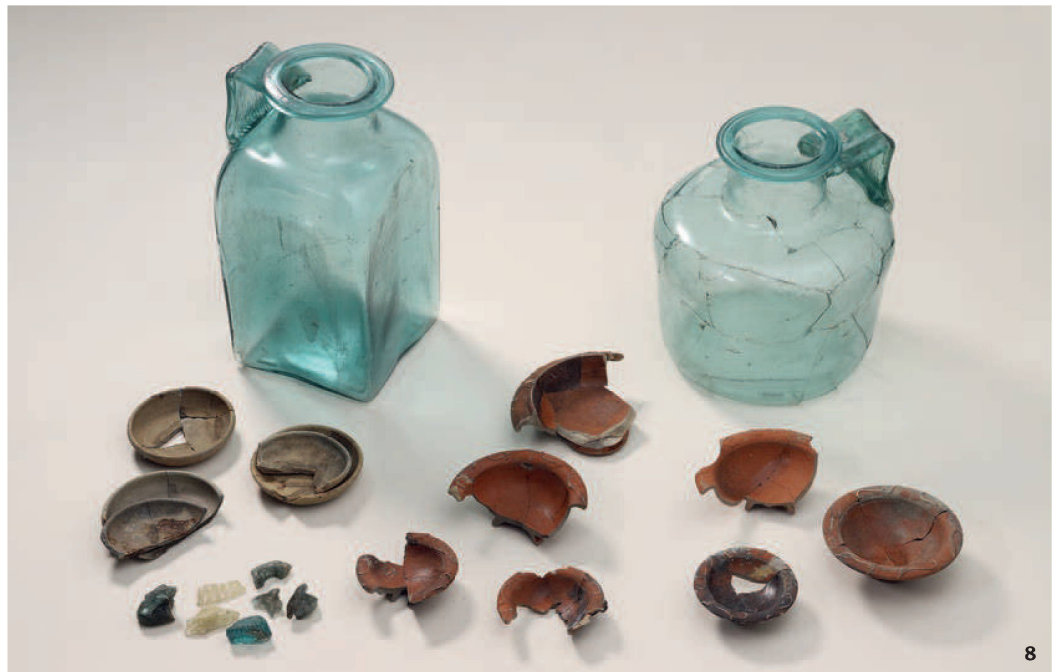
Fig. 8 Urnes en verre et choix d'offrandes accompagnant les deux sépultures à crémation de la villa rustica de Flumenthal-Scharlenmatte.

Après la crémation, les proches ont déposé les restes d'ossements calcinés dans des urnes en verre qu'ils ont placées dans des fosses, à environ 200 m du bâtiment central: les deux tombes se trouvaient ainsi probablement en dehors du mur d'enceinte de la villa , puisqu'il était interdit d'enterrer les morts à l'intérieur d'une zone habitée. Les deux sépultures étaient disposées côte à côte: il s'agissait peut-être d'un couple, réuni dans la mort? Seule certitude: aucune autre tombe n'a été retrouvée dans les environs immédiats.