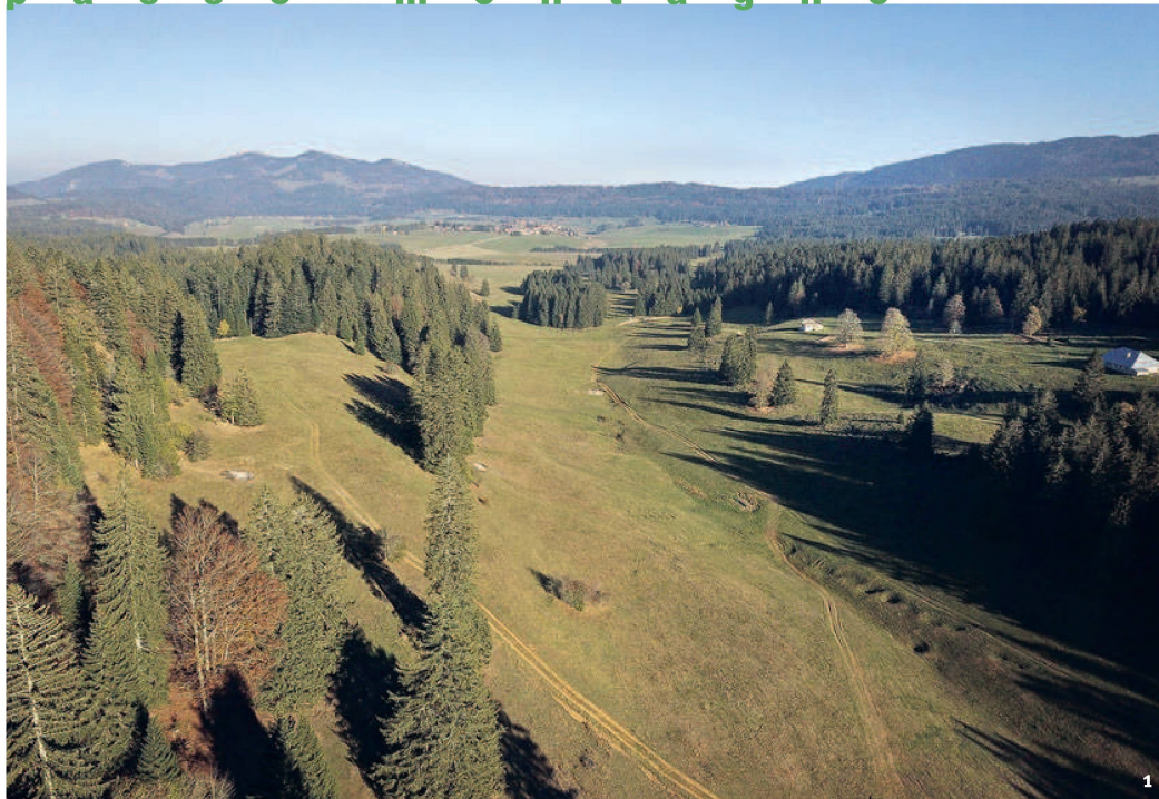
Fig. 1 Vue du vallon du Vairnon (Doubs) avec le Mont Chasseron (VD) en arrière-plan.

Blick auf das Vairnon-Tal (Doubs) mit dem Chasseron (VD) im Hintergrund.