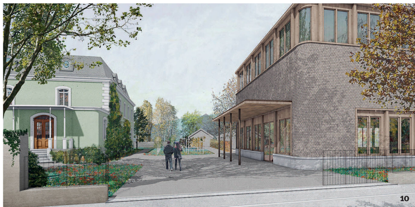
Fig. 10 Vue externe du futur centre de recherche et de conservation des collections cantonales de paléontologie, d'archéologie et de sciences naturelles à Porrentruy, 2019 (projet ORIGINE, lauréat du concours d'architecture).

Aussenansicht des künftigen Forschungs- und Konservierungszentrums für die kantonalen paläontologischen, archäologischen und naturwissenschaftlichen Sammlungen in Porrentruy, 2019 (Projekt ORIGINE, Gewinner des Architekturwettbewerbs).