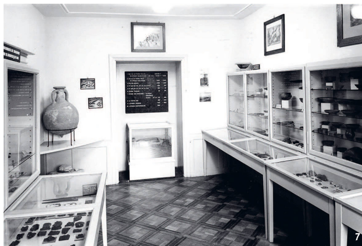
Fig. 7 La salle d'archéologie du Musée jurassien de Delémont en 1954.

Der Archäologie-Saal des Musée jurassien in Delémont im Jahr 1954.