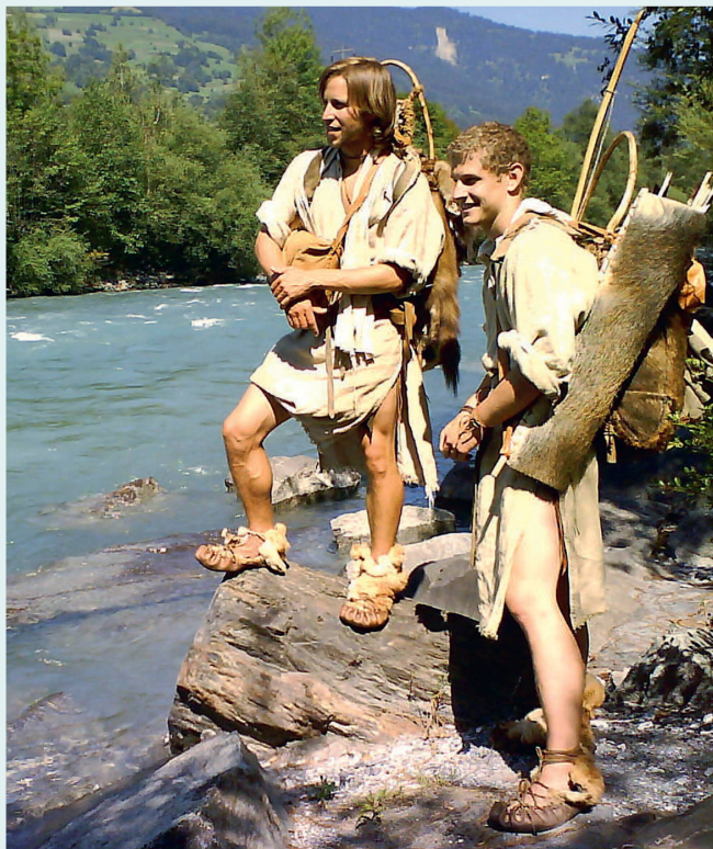
Die beiden «Pfalhbauer von Pfyn» auf dem Weg ins Bündnerland, um Salz zu besorgen.

L'émission «Pfahlbauer von Pfyn» a connu un succès retentissant. Le public s'est enthousiasmé pour le caractère authentique du village, les images à couper le