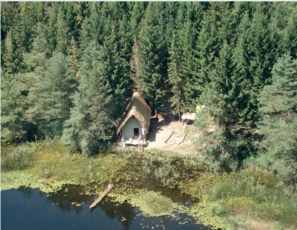
Das nachgebaute Dorf der «Pfahlbauer von Pfyn» im Sommer 2007.

Die «Pfahlbauer von Pfyn» waren ein Grosse Erfolg. Der Reiz fürs Publikum lag in der authentischen Anlage, den fantastischen Bildern und der immer neuen Fragestellung, dem persönlichen Abgleich: «Hätte ich das auch geschafft, hätten wir das bewältigt?» Danach kam es zu weiteren solchen Projekten: «Die Alpenfestung» (2009), «1914 – Die Fabrik» (2014) und «Leben im Schatten der Burg/Pilgerreise» (2016). Aus finanziellen Gründen stehen keine weiteren derartigen Fernsehexperimente mehr im Programm. Die Idee, Menschen von heute in fremde Umgebungen und ungewohnte Bedingungen eintauchen zu lassen, lebt vorerst in sogenannten Factual Entertainment-Formaten, wie zum Beispiel «Job-Tausch» oder «Meine fremde Heimat», weiter. — Thomas Schäppi, SRF