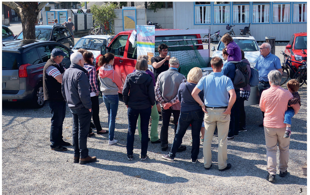
Abb. 3 Tag der offenen Grabung anlässlich der Tauchgrabung Göttingen 2019.

À tous les niveaux politiques, qu'il s'agisse de la Confédération, du Canton ou de la Commune, nous évoluons dans un cadre législatif clairement défini. Ceci vaut également pour le service archéologique, qui fait partie intégrante de l'administration cantonale. L'article 724 du Code civil régleme quelles sont les obligations des citoyen·nes en cas de découverte d'antiquités, ainsi que les obligations que l'État doit respecter, comme celle de fournir une compensation au propriétaire en cas de fouille archéologique. La Loi cantonale sur la protection de la nature et du paysage et l'ordonnance qui en découle définissent la marge de manœuvre pour les prises de décision et constituent au quotidien les principaux instruments législatifs des archéologues, avec le contrat de prestation du gouvernement. Au jour le jour, il faut trouver des solutions et accepter des compromis, afin de répondre aux différentes exigences légales et aux attentes de la population. Les ressources nécessaires à une approche scientifique approfondie et critique du mobilier et des structures archéologiques mis au jour sont