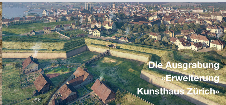
Die Ausgrabung «Erweiterung Kunsthhaus Zürich»