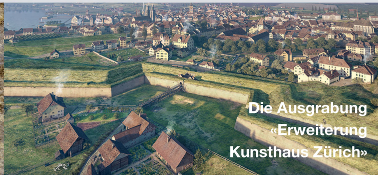
Die Ausgrabung «Erweiterung Kunsthhaus Zürich»