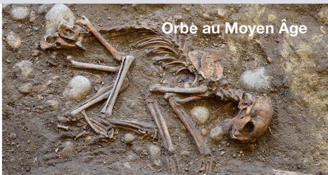
Orbe au Moyen Âge