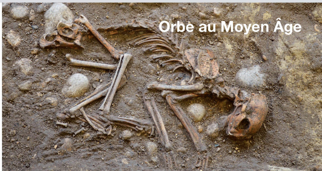
Orbe au Moyen Âge