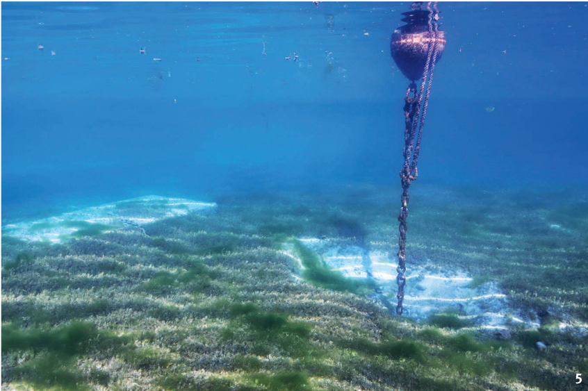
Fig. 5 Système d'amarrage des bateaux ayant endommagé la couche archéologique de la station de la Belotte.

System zur Verankerung von Schiffen, das die archäologischen Befunde der Station Belotte beschädigt hat.