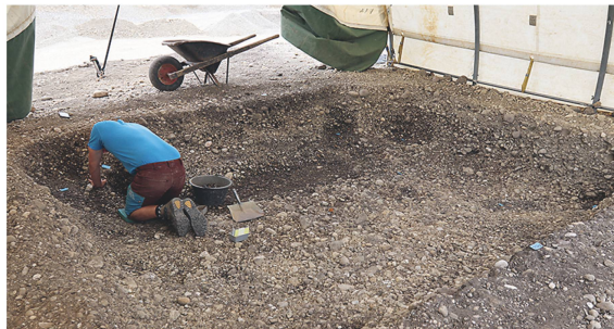
6 Frühmittelalterliches Grubenhaus in Marthalen-Nidermartel.