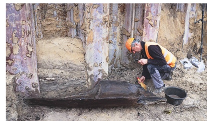
8 Der Einbaum von Sugiez bei seiner Freilegung.