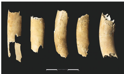
5 Die fünf Fragmente des Mammutstosszahns aus Wynau.