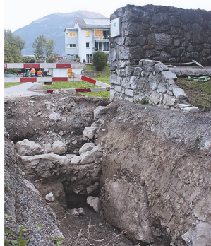
1 Blick auf den freigelegten (l.) sowie einen rekonstruierten (r.) Abschnitt der Letzimauer.