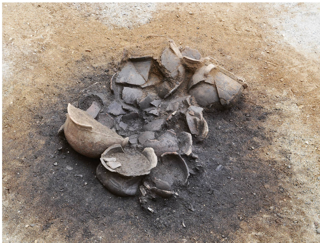
7 Lausanne-Vidy – Bois-de-Vaux 22. Détail du dépôt funéraire. Les résidus du bûcher, réunis dans un contenant en matière périssable, sont déposés au fond de la fosse. Au-dessus sont installés onze vases d'accompagnement, placés dans un autre contenant.

Lausanne-Vidy – Bois-de-Vaux 22. Detail der Bestattung. Die Scheiterhaufenreste wurden in einem Behälter aus vergänglichem Material auf der Sohle der Grabgrube niedergelegt. Darüber wurden elf Beigabengefässe in einem weiteren Behälter platziert.