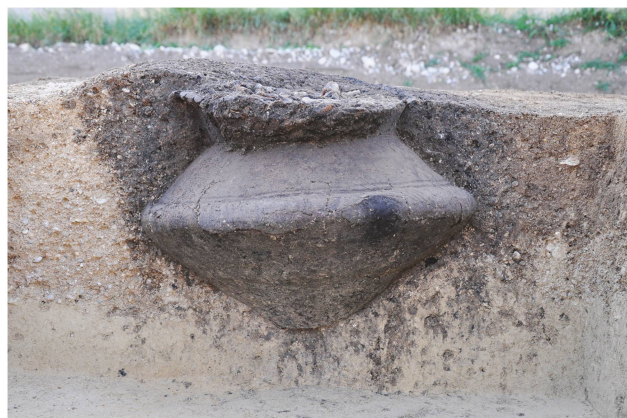
4 Orbe – Chemin de l'Étraz 18. La tombe ST 4 en cours de fouille, vue en coupe. La fosse, de forme circulaire, est ajustée aux dimensions de l'urne.

Qu'il s'agisse d'inhumations ou de crémations, les tombes sont généralement individuelles, les sépultures doubles restant exceptionnelles. Les crémations sont majoritaires sur l'ensemble du territoire. Elles sont constituées des restes du défunt collectés sur le bûcher et déposés dans une urne en céramique, accompagnés d'objets variés (vases, parures) et parfois d'offrandes alimentaires. La pratique de l'inhumation se poursuit discrètement, elle n'est majoritaire qu'à Tolochenaz. On peut souligner la grande variabilité des mises en scène des dépôts et des architectures funéraires, qui nous renvoient l'image d'une forte personnalisation de la sépulture.