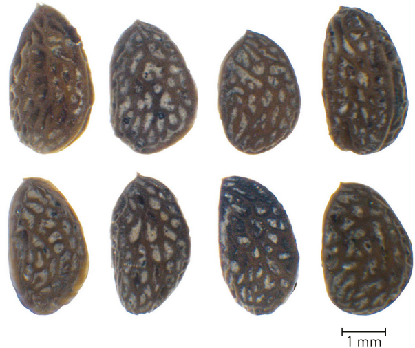
2 Unverkohlte Samen von Brombeeren aus der jungsteinzeitlichen Seeufersiedlung von Biel-Campus (BE).

Am 20. Oktober 2023 feierte die IPNA ihr 20-jähriges und damit das Laboratorium für Urgeschichte, aus dem die IPNA hervorging, sein 50-jähriges Jubiläum. IPNA steht für Integrative Prähistorische und Naturwissenschaftliche Archäologie und ist eine Forschungseinheit des Departements Umweltwissenschaften der Universität Basel. Die IPNA beherbergt eine Vielzahl von Disziplinen, die an der Auswertung archäologischer Fundstellen beteiligt sind, darunter Archäobotanik, Archäozoologie, Archäoanthropologie, Archäogenetik, Isotopenanalyse, Geoarchäologie und Prähistorische Archäologie. In Zusammenarbeit mit Kantonsarchäologien, Universitäten und anderen Forschungszentren werden an der IPNA nationale und internationale Auswertungsprojekte durchgeführt, die den gesamten Zeitraum von der Steinzeit bis in die Neuzeit umfassen. Einen wichtigen Fokus bilden die Schweizer Seeufersiedlungen, die aufgrund der ausgezeichneten Erhaltung organischer Kulturschichten exzellente Voraussetzungen für interdisziplinäre Kooperationen bieten.