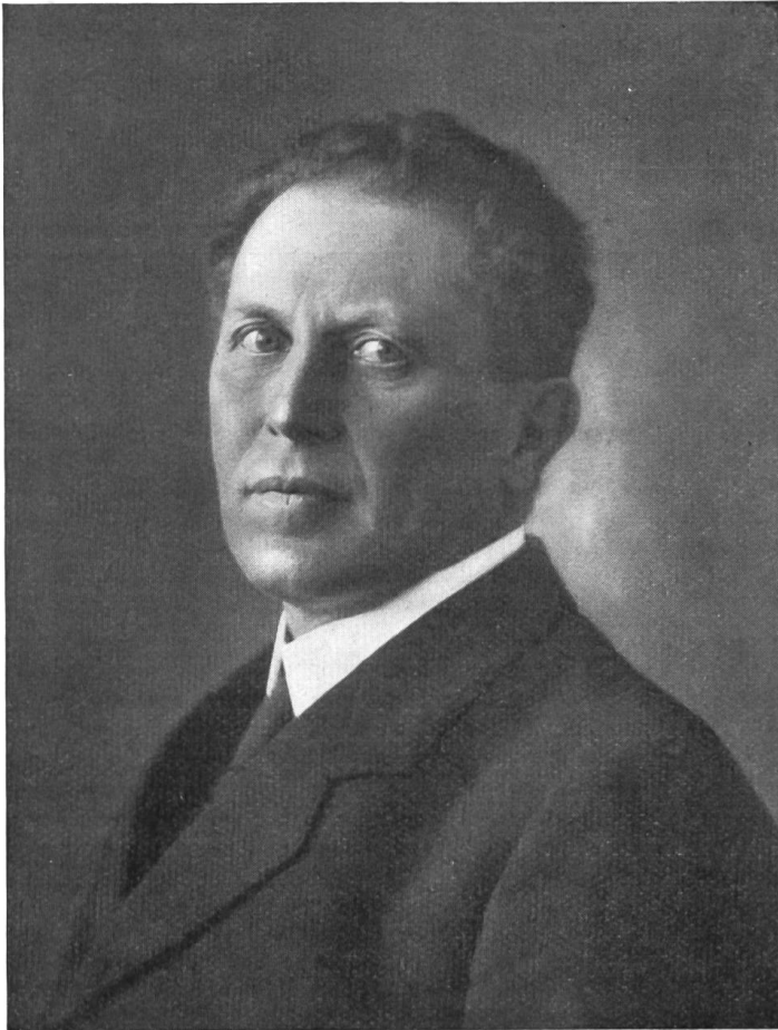
Dr. ing. h. c. W. Boveri, † 28. Oktober 1924.

gesellschaft Baden. — Boveri war der gegebene Mann, um dem jungen Unternehmen die Unterlagen für die Beschäftigung zuzuführen. Durch sein 1 bestimmtes, ruhiges Auftreten und durch eine klare Sprache wusste er das Vertrauen der Interessenten für die damals vollständig neuen technischen und wirtschaftlichen Probleme zu erwerben. Die technischen Erfolge und die Idee der vermehrten Ausnützung der Wasserkräfte