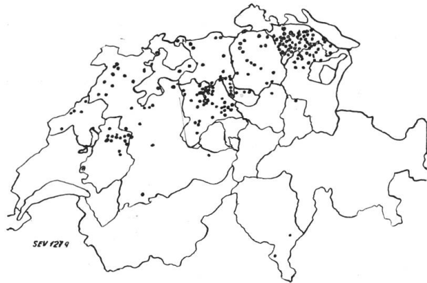
Fig. 2. Karte der durch Selbstentzündung verursachten Uebergärungen und Bränden von Heustöcken in der Schweiz im Jahre 1925.

Es ist auffallend, dass dem künstlichen Grastrocknen noch nicht mehr Aufmerksamkeit geschenkt wurde. Namentlich sollten die Brandversicherungsanstalten diese Technik vielleicht subventionieren; denn es ist ausgeschlossen, dass ein Heustock mit künstlich getrockneter Ware zur Selbstentzündung gerät.