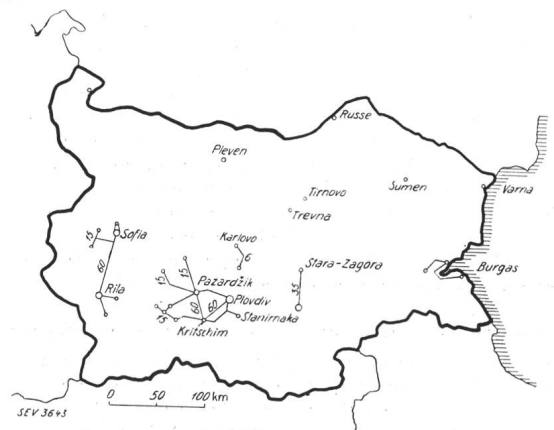
Fig. 1. Plan der Hochspannungsleitungen Bulgariens. (Die Zahlen bei den Leitungen bedeuten die Spannung in kV.)

Der Beginn der Entwicklung der bulgarischen Elektrizitätswirtschaft reicht bis in das Jahr 1901 zurück, als in Pancrevo ein hydroelektrisches Kraftwerk für die Elektrizitäts-A.-G. Sofia erstellt wurde. Im Jahre 1912 folgte die Erstellung eines Dieselmotorkraftwerkes in Kisanlik und kurz darauf die