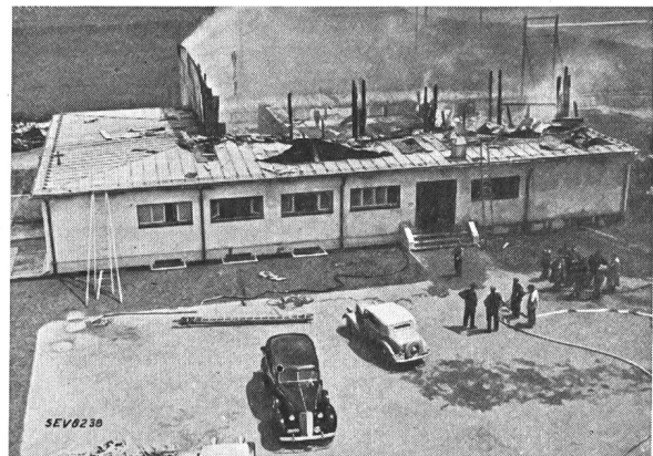
Fig. 2. Brand des Kurzwellensenders Schwarzenburg. Gesamtansicht. 6. Juli 1939.

Zu den Kontrollpflichten der Ueberwachung nach Emissionsschluss gehört u. a. die sorgfältige Ueberprüfung aller in der gefährdeten Zone (im vorliegenden Fall also hauptsächlich das Transformatorenpodest und die Antennenzuleitung) gelegenen Anlageteile. Diese Kontrolle wurde auch in der kritischen Nacht ausgeführt und ergab keinerlei abnormale Feststellungen.