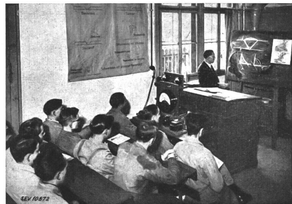
Fig. 1. Theoriestunde

ärgert, benützten die Handwerker oft nur noch zur Not die Elektroschweissapparate. Ein gewisses Misstrauen gegen dieses Schweissverfahren wollte Platz greifen. Diese Erscheinung war dem Umstand zuzuschreiben, dass der Maschinenverkäufer dem Benutzer in einem kurzen Vorführungsschweissen den Apparat wohl erklärt und vordemonstriert hatte, dann aber blieb der Käufer sich selbst überlassen. Je nach Können oder Selbststudium konnte er nun den teuer gekauften Apparat mehr oder weniger gut anwenden. Schweissen muss man lernen und lehren, und zwar nicht vom Nebenmann, der oft auch keine methodische Anleitung erfahren hat.