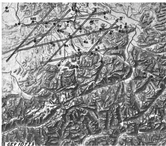
Fig. 3. Gewitterzugsrichtungen und Gewitterstrassen

Nach den Untersuchungen von Hess, welcher sich eingehend mit den Problemen der Gewitterzüge befasst hat und welche mit unsern eigenen Beobachtungen weitgehend übereinstimmen, herrschen in der SW-NE-Richtung vier ausgeprägte Gewitterstrassen vor. Die westlichste davon verläuft quer über den Jura nach dem Schwarzwald, die zweite über das mittlere Mittelland, über das Rafzerfeld in das Gebiet des hohen Randen, die dritte vom mittleren Voralpenland durch das Zürcher