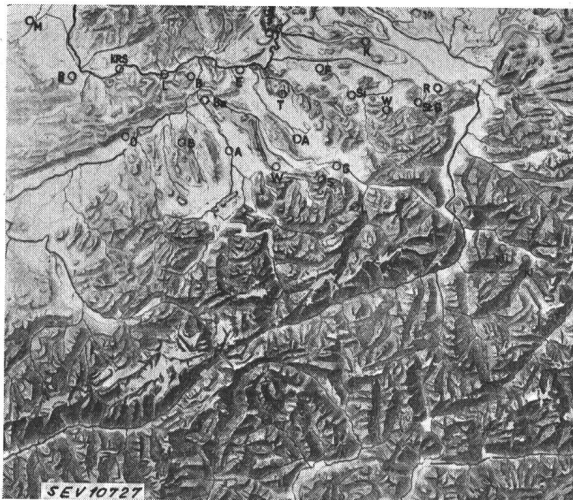
Nr. 6103 BRB 3. 10.39 (Fig. 1, 2, 3, 4, 7).

Das NOK-Netz erstreckt sich in der West-Ost-Richtung von Basel bis ins Rheintal, in der Nord-Süd-Richtung von Schaffhausen bis in die Vor-alpen (Linie Zug-Glarnerland). Die einfache Leitungslänge des betriebsmässig zugeschalteten 50-kV-Netzes beträgt 1200 km, diejenige des 150-kV-Netzes 450 km. Die geographische Lage der Gewitterbeobachtungspunkte, sowie die Verteilung derselben im NOK-Versorgungsgebiet ist aus Fig. 1 er-