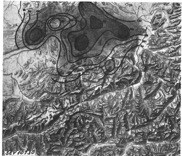
Fig. 4. Oertliche Verteilung der Gewitterhäufigkeit 9jährige Summation

arme Jahre, was jedem Betriebsleiter aus eigener Erfahrung bekannt ist. Eine Periodizität dieser Erscheinung ist bis heute nicht feststellbar. Es treten nach unsern Beobachtungen, je nach der geographischen Lage des Beobachtungspunktes, jährliche Häufigkeitsschwankungen im Verhältnis 1 : 2 bis 1 : 3 auf, so dass erst die langjährigen Auswertun-