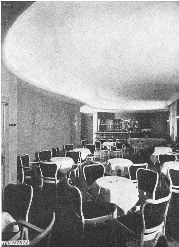
Fig. 9. Indirekte Beleuchtung einer Bar mit Hochspannungs-Fluoreszenzröhren

haltung von Hochspannungs-Leuchtröhren-Anlagen zu beachten sind 2) . Bei deren Befolgung ist die Gewähr für Betriebssicherheit und Gefährlosigkeit auch von Hochspannungs-Fluoreszenzröhren-Anlagen geboten, wobei nicht ausgeschlossen ist, dass durch Material- oder Installationsfehler, genau wie bei Niederspannungs-Anlagen, Defekte mit den entsprechenden Folgen auftreten können.