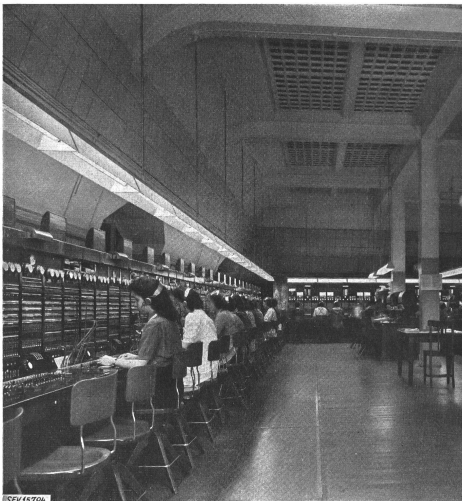
Fig. 5 Fernamt mit Fluoreszenz-Lampen Diffusoren mit opaleszenten Seitenflächen. E_m = 300 Lux.

Licht und Beleuchtung haben für den Verkauf nicht nur arbeitstechnische, wirtschaftliche und physiologische Bedeutung, sie wirken sich in wesentlichem Masse auch psychologisch aus dadurch, dass gutes Licht und angenehme Beleuchtung die Arbeitsfähigkeit des Personals und die Kauflust des