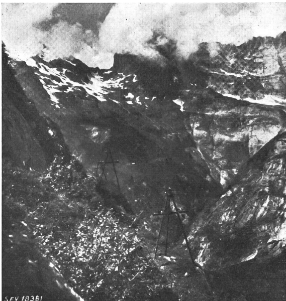
Fig. 1 Dreieck- und Pyramiden-Masten 16-kV-Leitung Innertkirchen-Gauli

Eine Placierung von normalen Holzmasten in der üblichen Distanz von 45...50 m kommt selten in Frage.