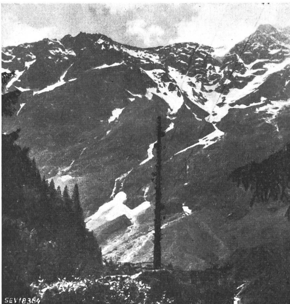
Fig. 4 Natürlicher Stützpunkt

Stützpunkt wurde mit Abspannmateriale ausgerüstet, wodurch grössere Spannweiten erzielt und seitliche Züge ohne weiteres aufgenommen werden konnten. Zur Befestigung der Abspannkette wurden 3...4 m