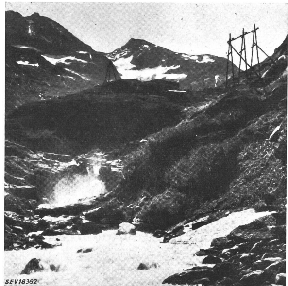
Fig. 2 Abspannstützpunkte 16-kV-Leitung Innertkirchen-Gauli

teuer, und das Aufstellen der Stangen ist oft mit Schwierigkeiten verbunden, da diese Felslöcher in den meisten Fällen viel zu gross werden. Dies veranlasste die KWO, eine andere Stangenfussbefestigung anzuwenden. An jedes Stangenfussende werden Flacheisen angeschraubt, die an einem Ende