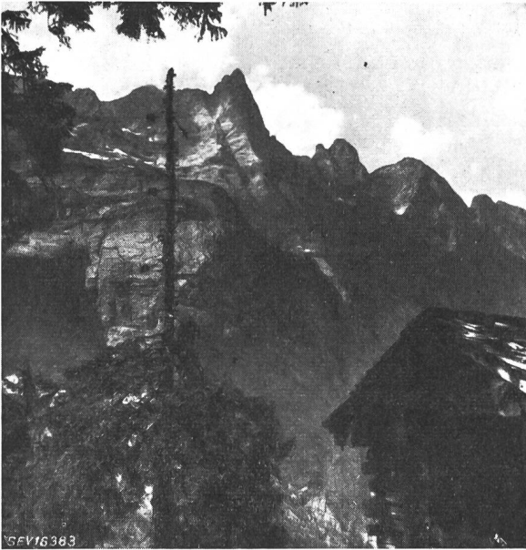
Fig. 3 Natürlicher Stützpunkt

An der Peripherie oder in der Mitte des Waldkomplexes, auch längs einer natürlichen Waldlichtung folgend, wurden möglichst hohe Bäume gewählt und zu Stützpunkten hergerichtet. Jeder